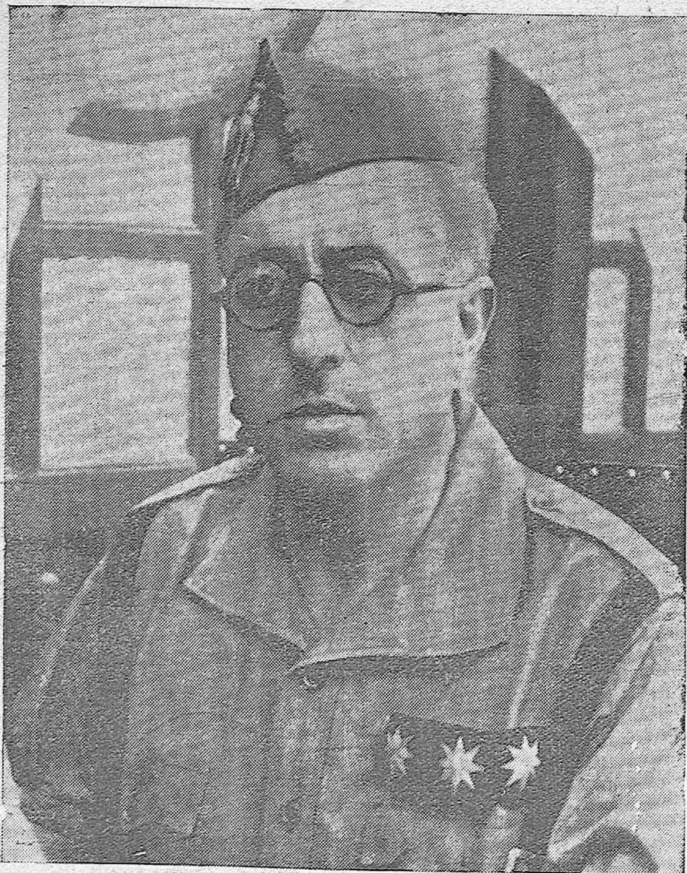
El heroico coronel Yagüe, jefe de la Legión, cuya magnífica respuesta a Falange de Segovia, insertamos en este número