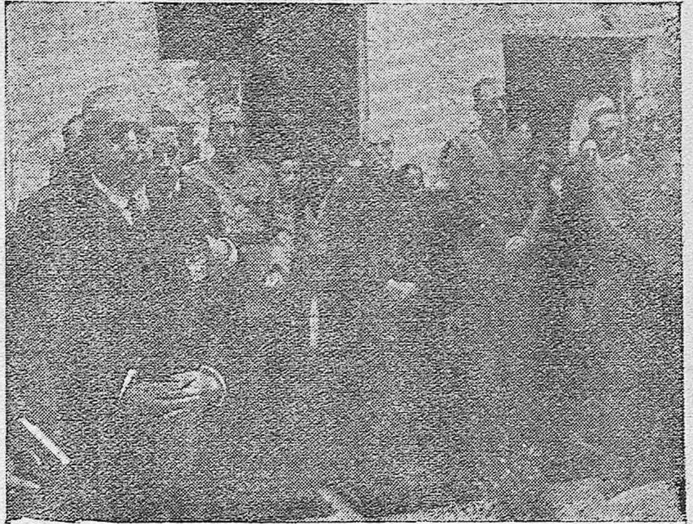
Las autoridades presidiendo la Misa de campaña celebrada en la Casa de Correos de Córdoba.