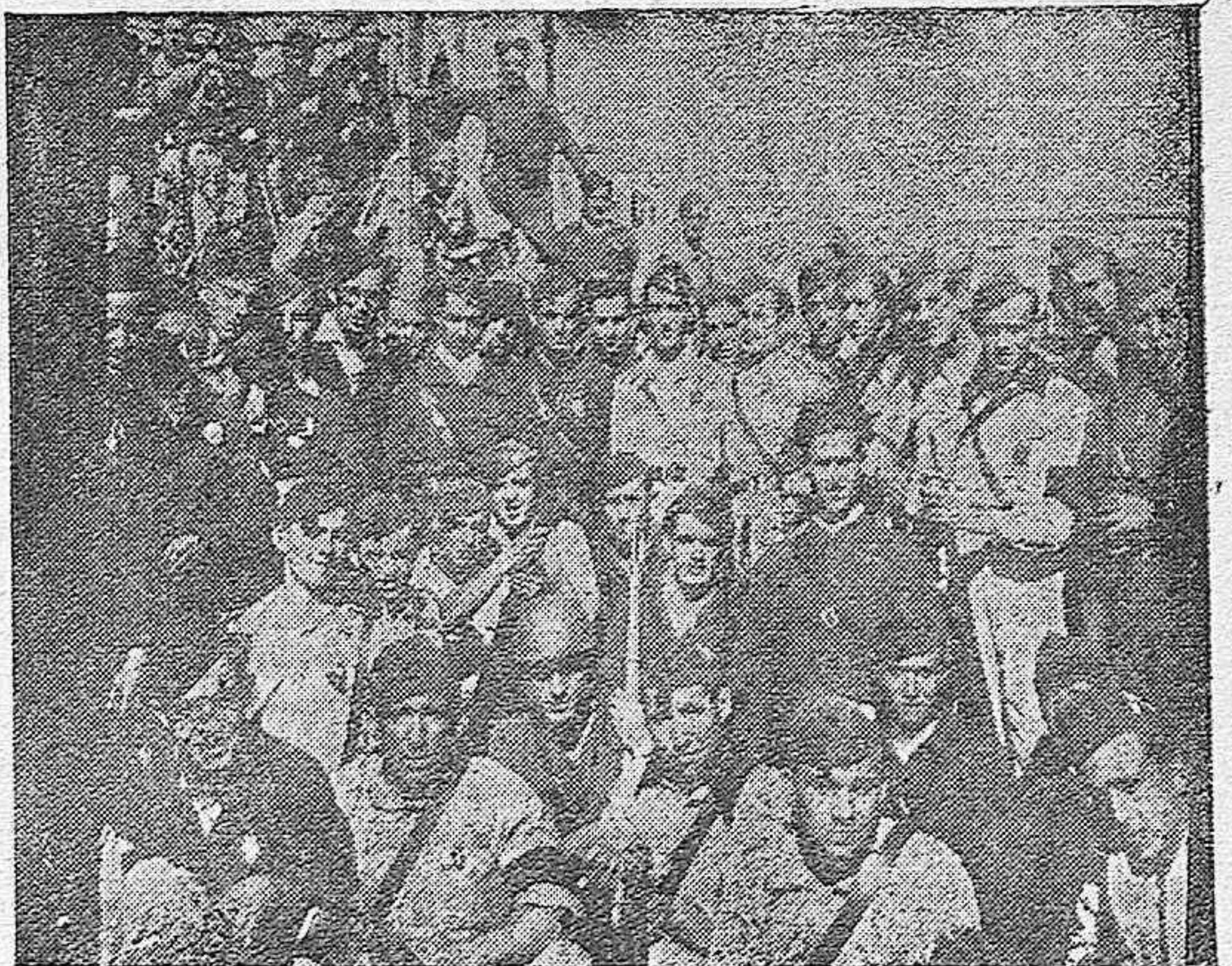
Grupo de heroicos falangistas que se distinguieron en la toma de Puzos Nuevo del Terrible.