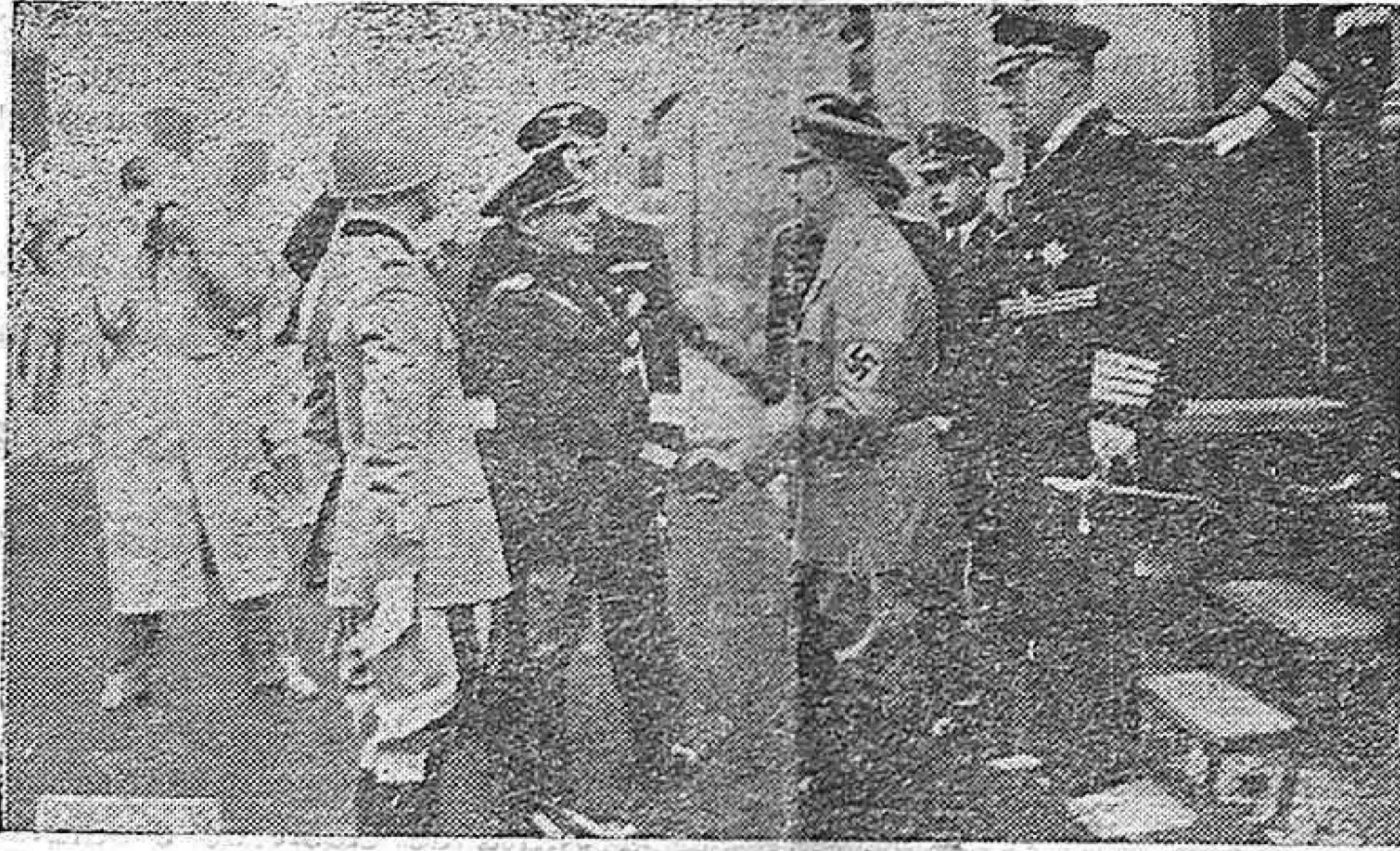
ROMA.—La visita de Hitler a Italia. Llegada del Canciller alemán a Brennero.

El Gobierno, inspirado en el sentido de justicia que es norma de todos sus actos, será inflexible en la aplicación de las sanciones a los comerciantes que eleven los precios y a los compradores que, sabiéndolo no lo denuncian.