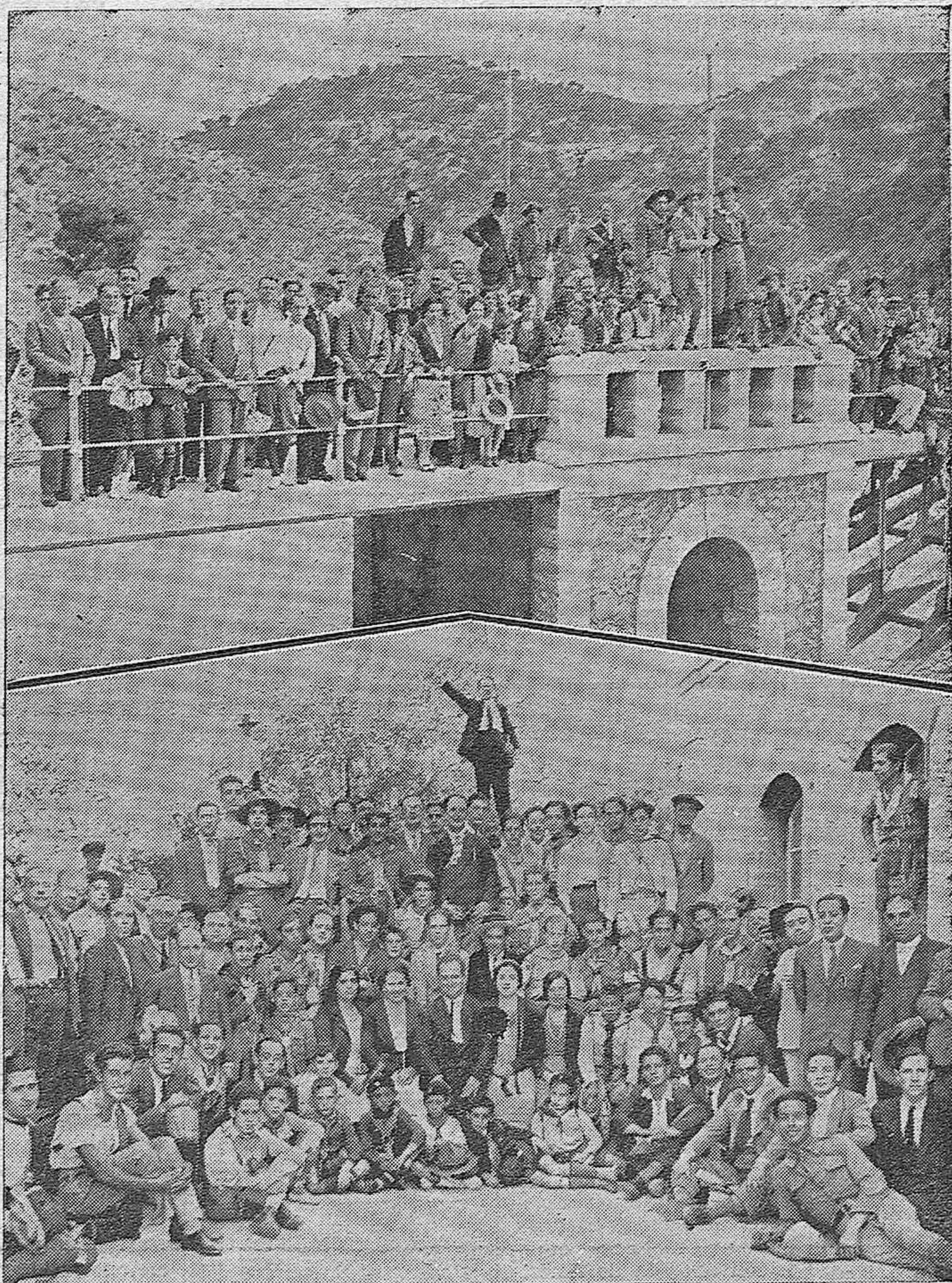
LA EXCURSION DE LOS EXPLORADORES CORDOBESES AL PANTANO DEL CHORRO.—Dos interesantes grupos de los excursionistas en los pintorescos lugares que visitaron el domingo último acompañados de muchos protectores de la simpática institución.