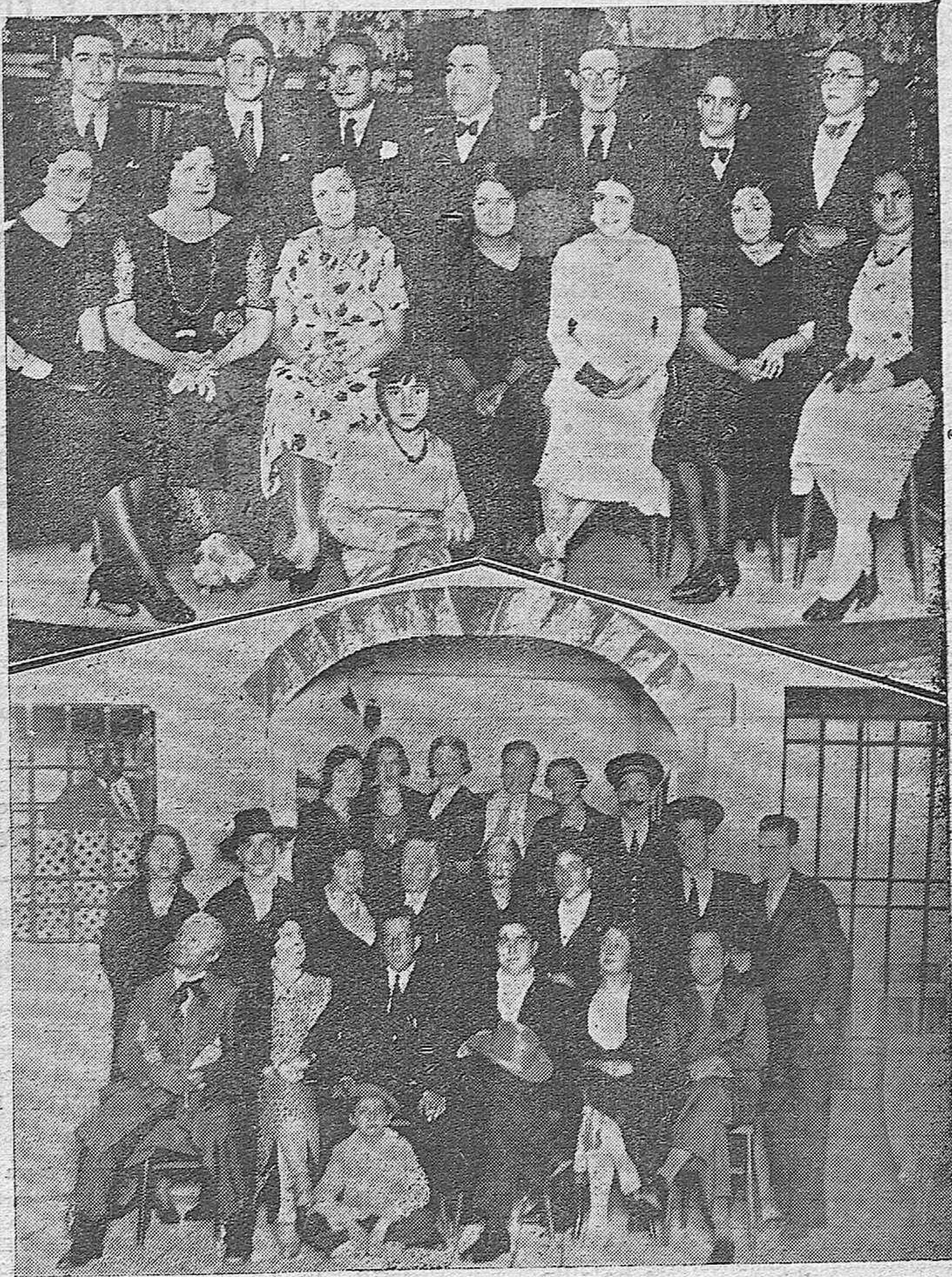
ACTUALIDAD GRAFICA CORDOBESA.—Alumnas del Conservatorio Oficial de Música que actuaron en el concierto celebrado ayer tarde.—Grupo de aficionados del cuadro artístico del Centro Filarmónico que representarán la zarzuela "La reina mora" en el festival benéfico del Gran Teatro.