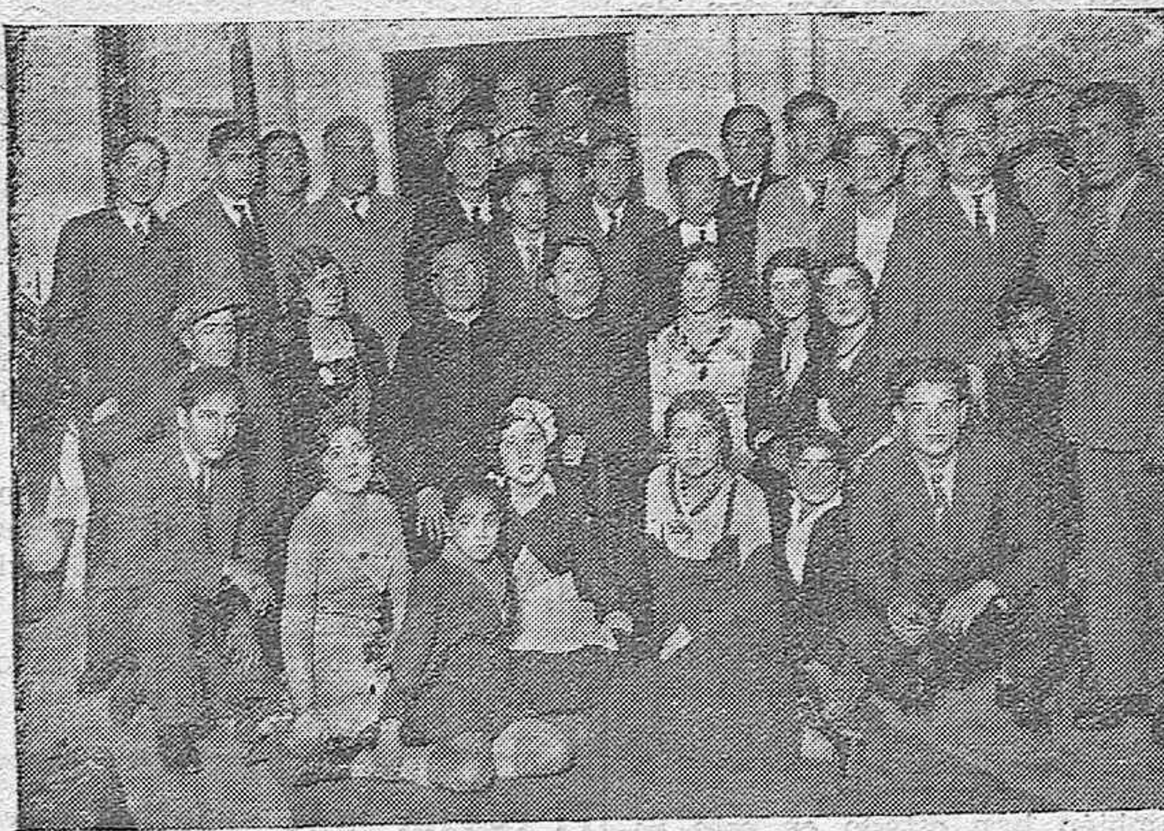
NOTA GRAFICA PROVINCIAL.—Peñarroya Pueblonuevo. Distinguidos jóvenes de la localidad que pusieron en escena la obra "Muchachas de Vanguardia", destinando el producto de la fiesta a socorrer a los necesitados