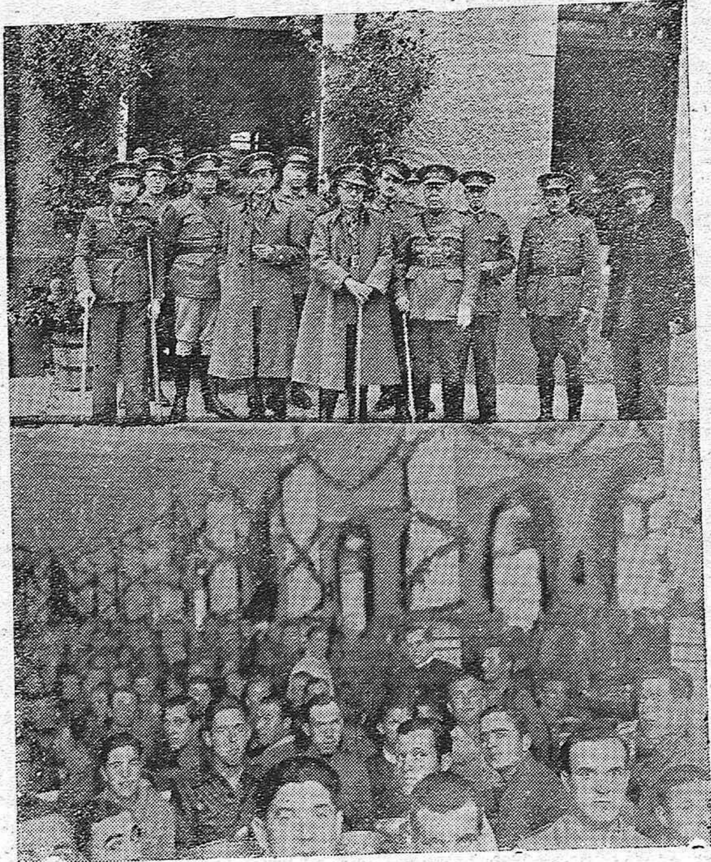
El ilustre General Cascajo, con los jefes y oficiales de Artillería, durante los actos celebrados con motivo de la festividad de Santa Bárbara.—El comedor del Cuartel de Artillería, durante la comida con que fué obsequiada la tropa con motivo de la festividad de Santa Bárbara.

El día 13 del actual mes de Diciembre y a las diez de la mañana, se celebrará en esta Casa Consistorial, la subasta para el arrendamiento de varios arbitrios municipales, por término de tres años y por el tipo de 49.000 pesetas cada año.