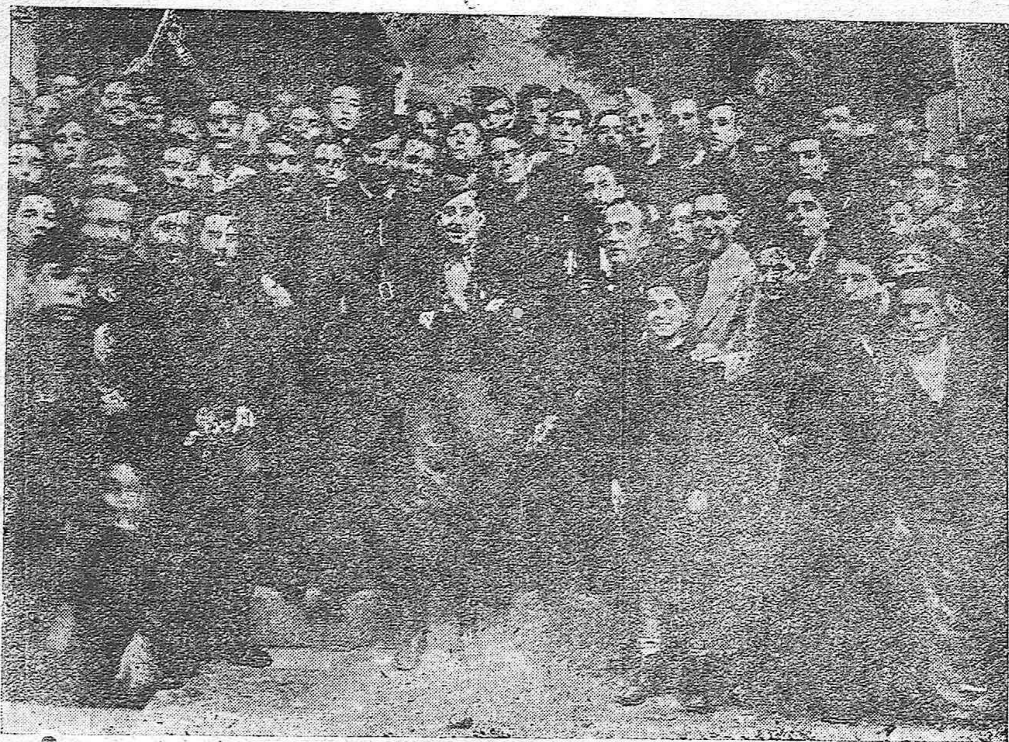
Los estudiantes portugueses llegaron a Córdoba, con el magnífico obsequio que la nación lusitana hermana envía a los bravos defensores de la causa nacional. Grupo de estudiantes portugueses saliendo de la Mezquita-Catedral.