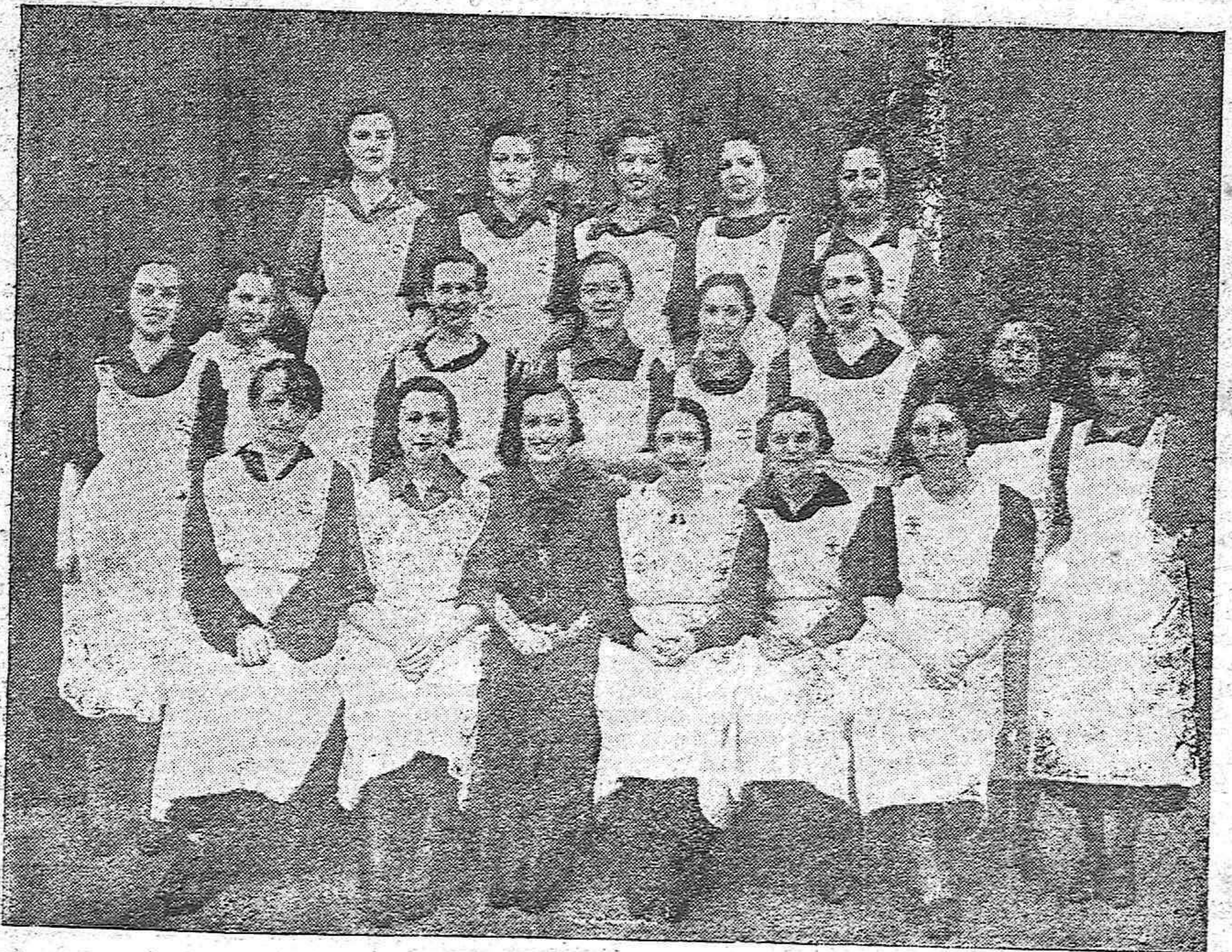
Sección Femenina de Falange Española, que se ha hecho cargo de la organización y funcionamiento del Comedor Infantil de Auxilio de Inverno.