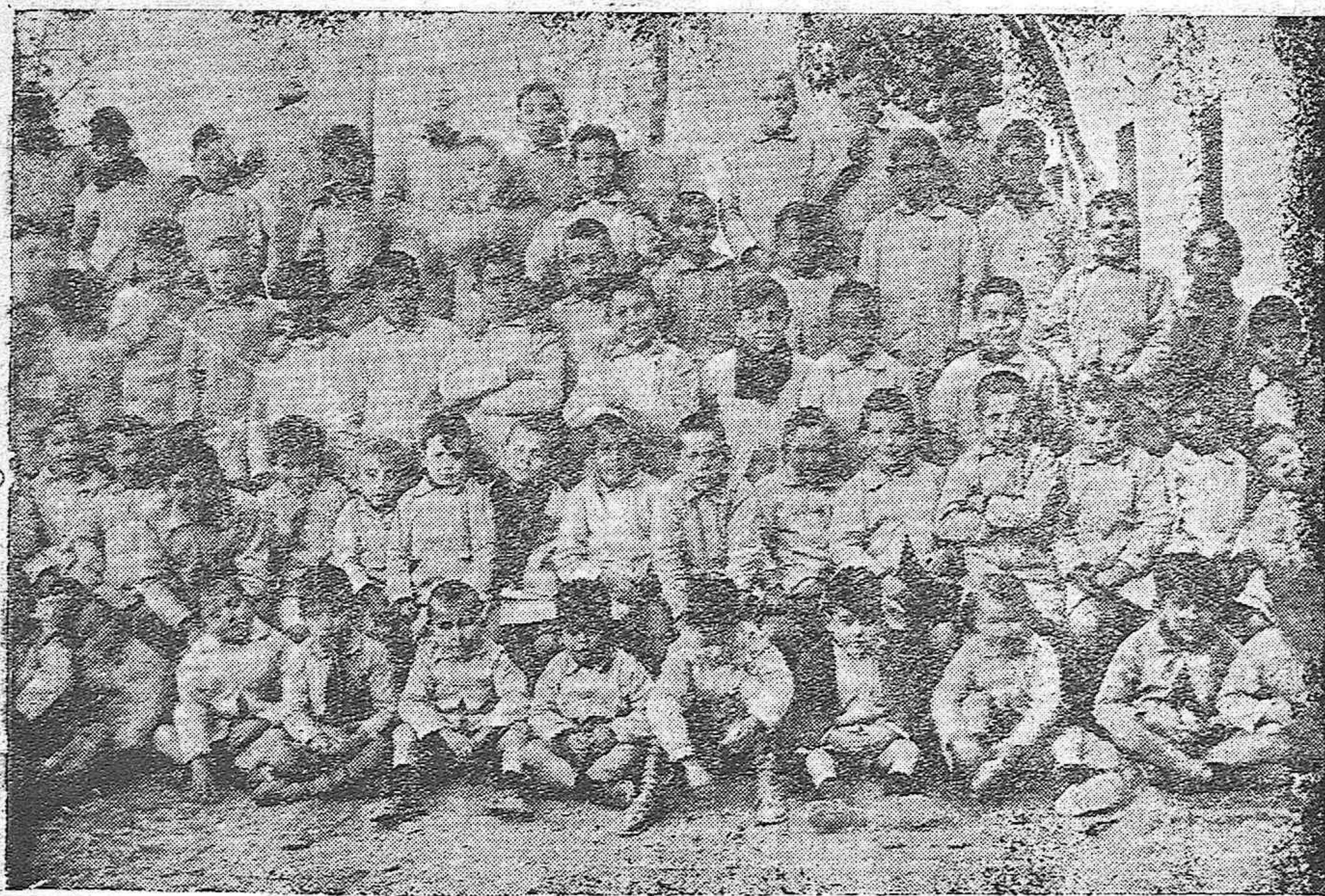
Grupo de los primeros acogidos en el "Orfanatorio de la Providencia" de Córdoba, admirable institución instalada en la calle de Alfonso XII.