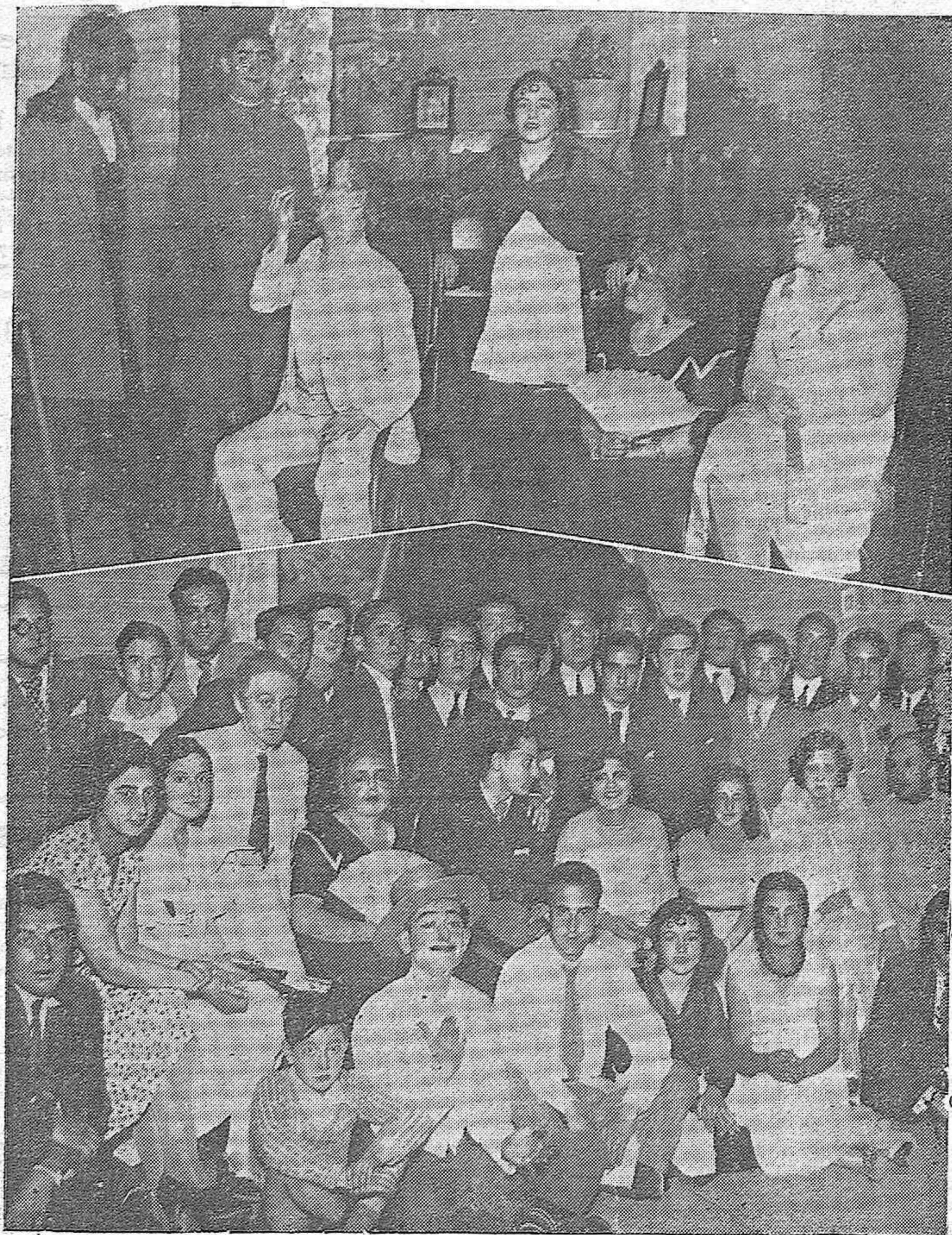
EL FESTIVAL DE LA F. U. E. EN EL TEATRO DUQUE DE RIVAS.—Una escena de la comedia de los Quintero "El Patio", interpretada admirablemente por estudiantes de ambos sexos.—Grupo general de estudiantes que intervinieron en el reparto total de la obra y que obtuvieron un rotundo éxito