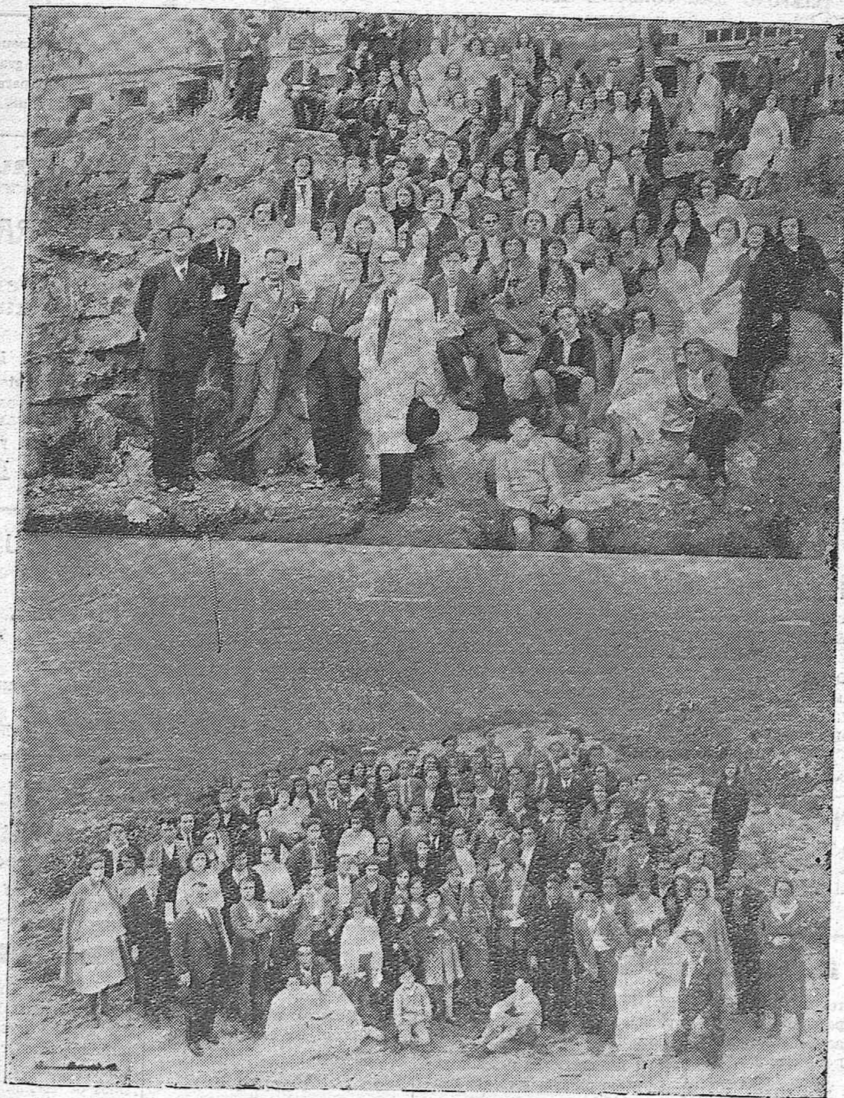
EXCURSION ESCOLAR.—Alumnos de la Escuela Normal del Magisterio Primario durante la visita que hicieron a las ruinas de Medina Azahara.