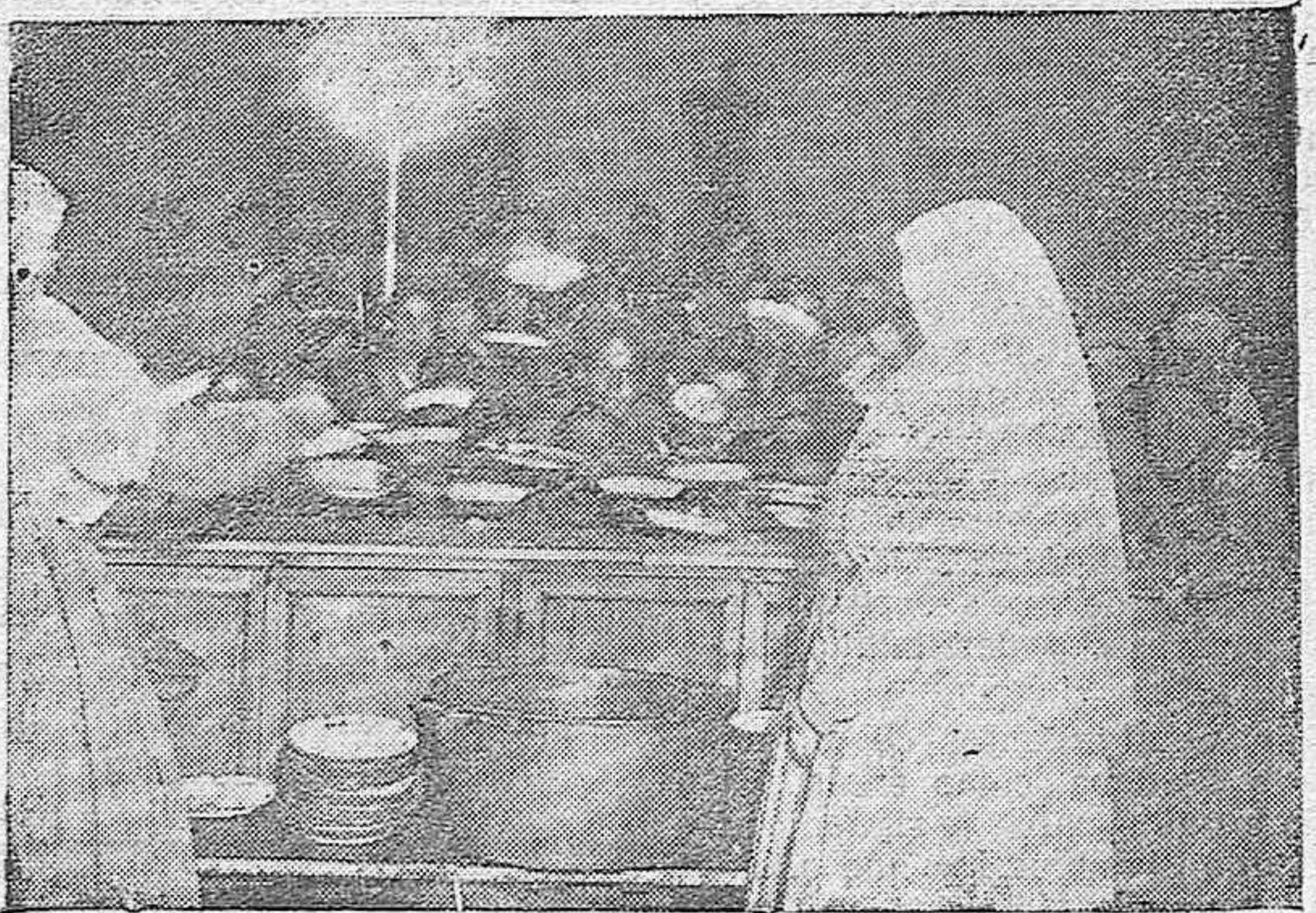
La hermosa cocina del Comedor de Caridad y el momento de reparar la comida a los niños pobres