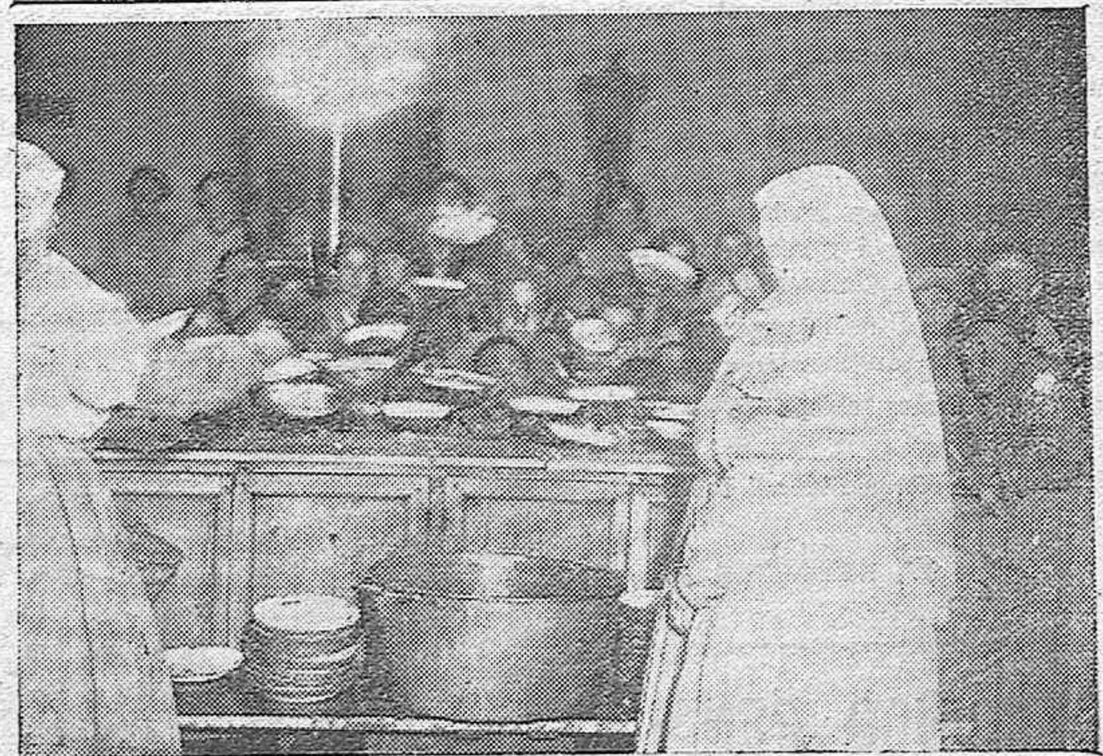
La hermosa cocina del Comedor de Caridad y el momento de repartir la comida a los niños pobres