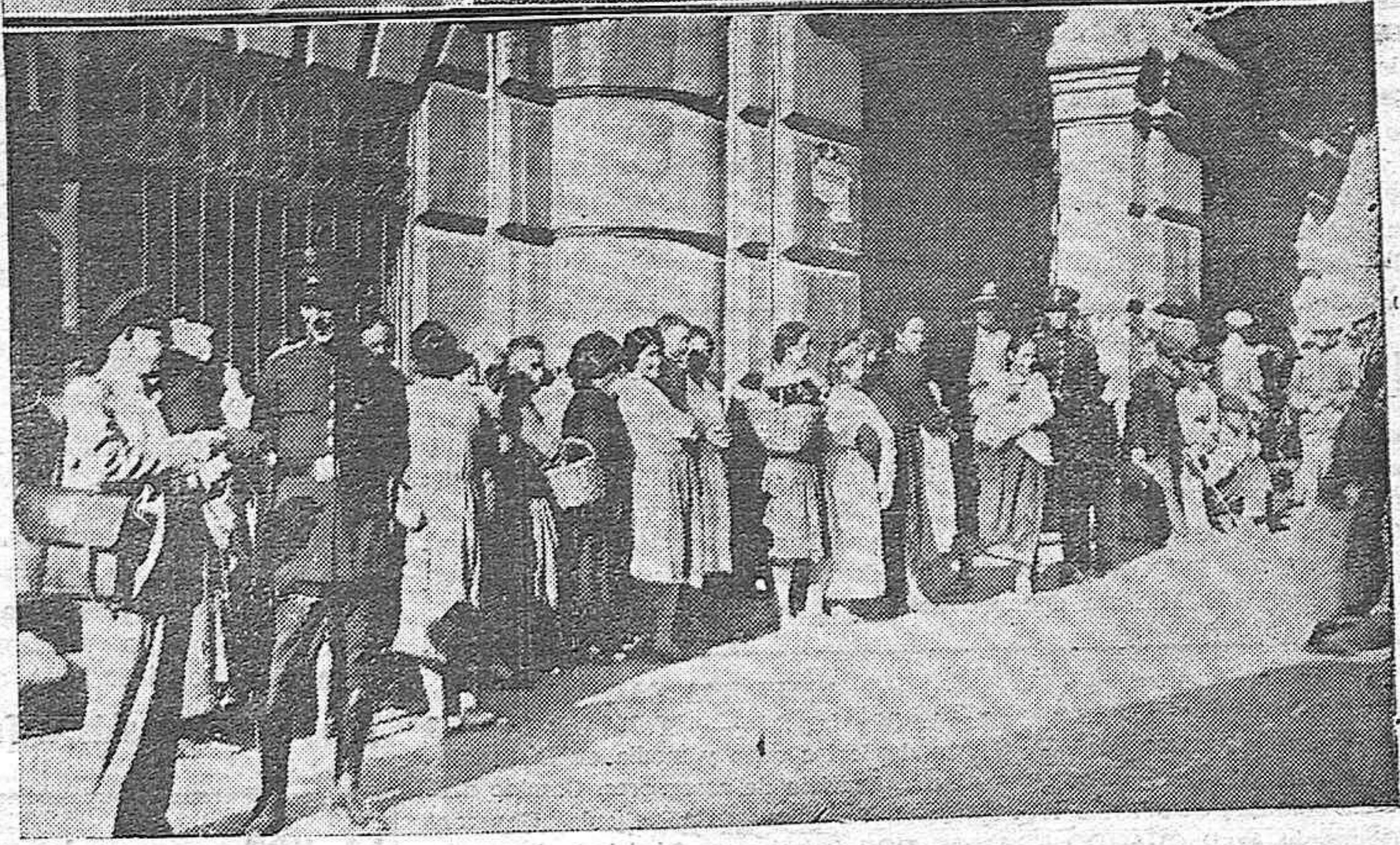
NOTAS GRAFICAS. —Los Maestros Nacionales de El Escorial que han llegado en viaje de estudios. Las colas en la puerta del Gobierno civil esperando los bonos de comida que diariamente facilitan para el comedor de caridad.