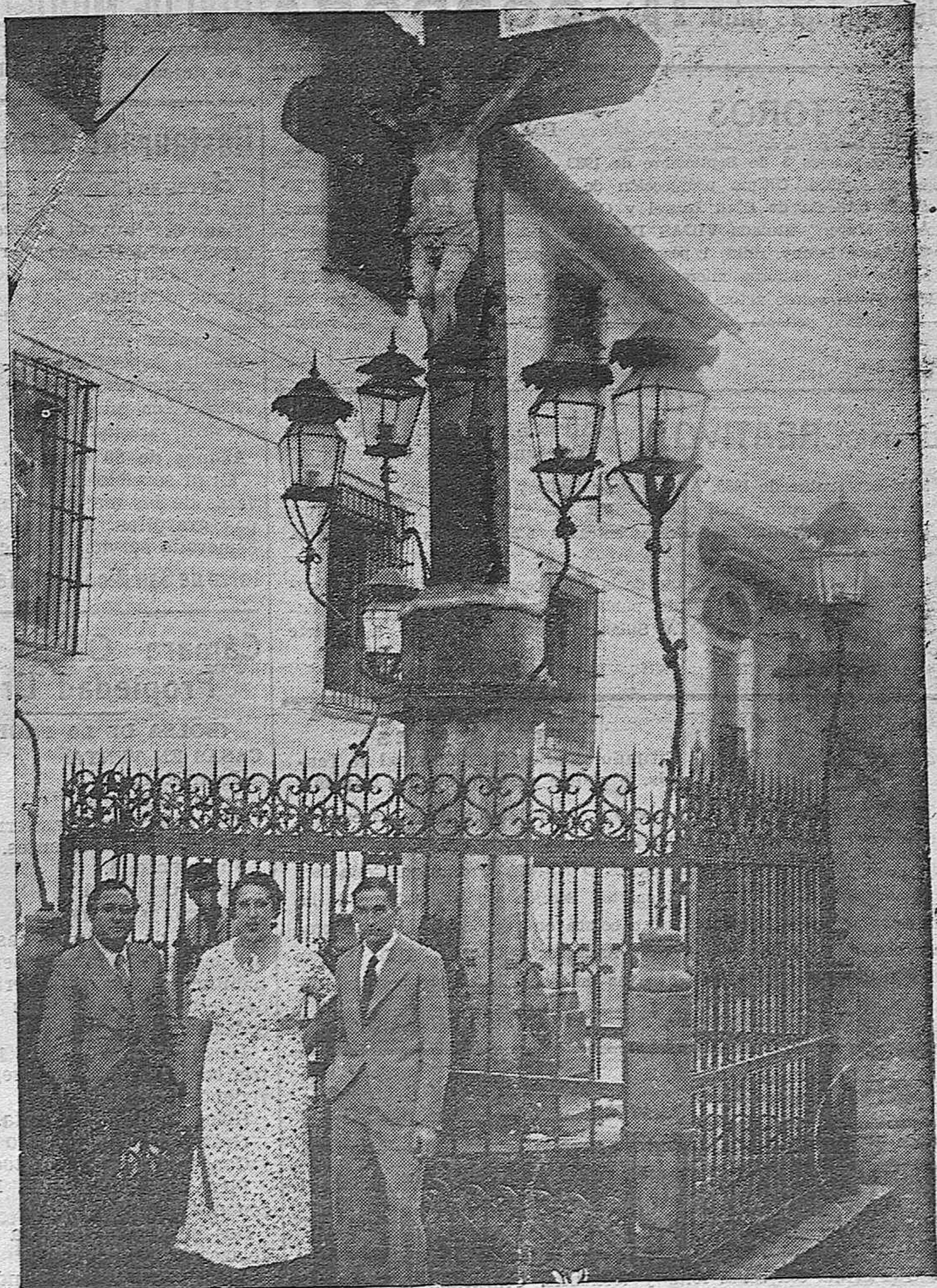
NOTAS GRÁFICAS. —El divo español Miguel Fleta, acompañado de su esposa ante el Cristo de los Faroles durante la visita que hicieron a la capital