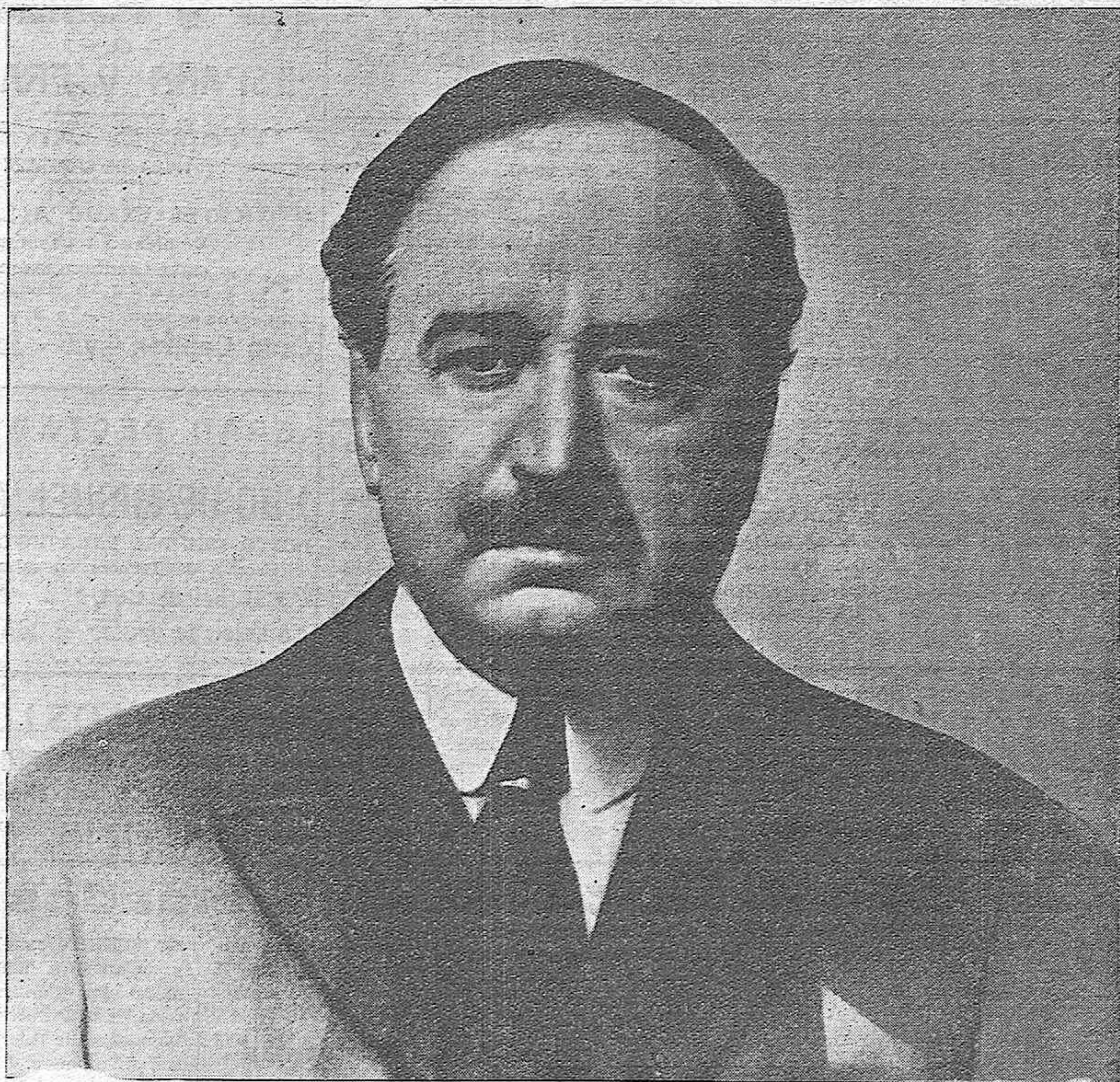
FIGURA MAGNIFICA Y VIDA FECUNDA QUE ESPAÑA PERDIO PARA SIEMPRE HACE HOY CUATRO AÑOS, A QUIEN LAS CORTES CONSTITUYENTES DE LA REPUBLICA ESPAÑOLA, DANDO UN ALTO EJEMPLO DE SENSIBILIDAD CIUDADANA Y RECOGIENDO EL ESPIRITU DE LA DEMOCRACIA NACIONAL QUE EL CONTRIBUYO A FORMAR, RINDEN EN ESTE DIA UN FERVOROSO HOMENAJE DE ADMIRACION ANTE LA TUMBA DEL INSIGNE REPUBLICANO QUE DUERME EN MENTON