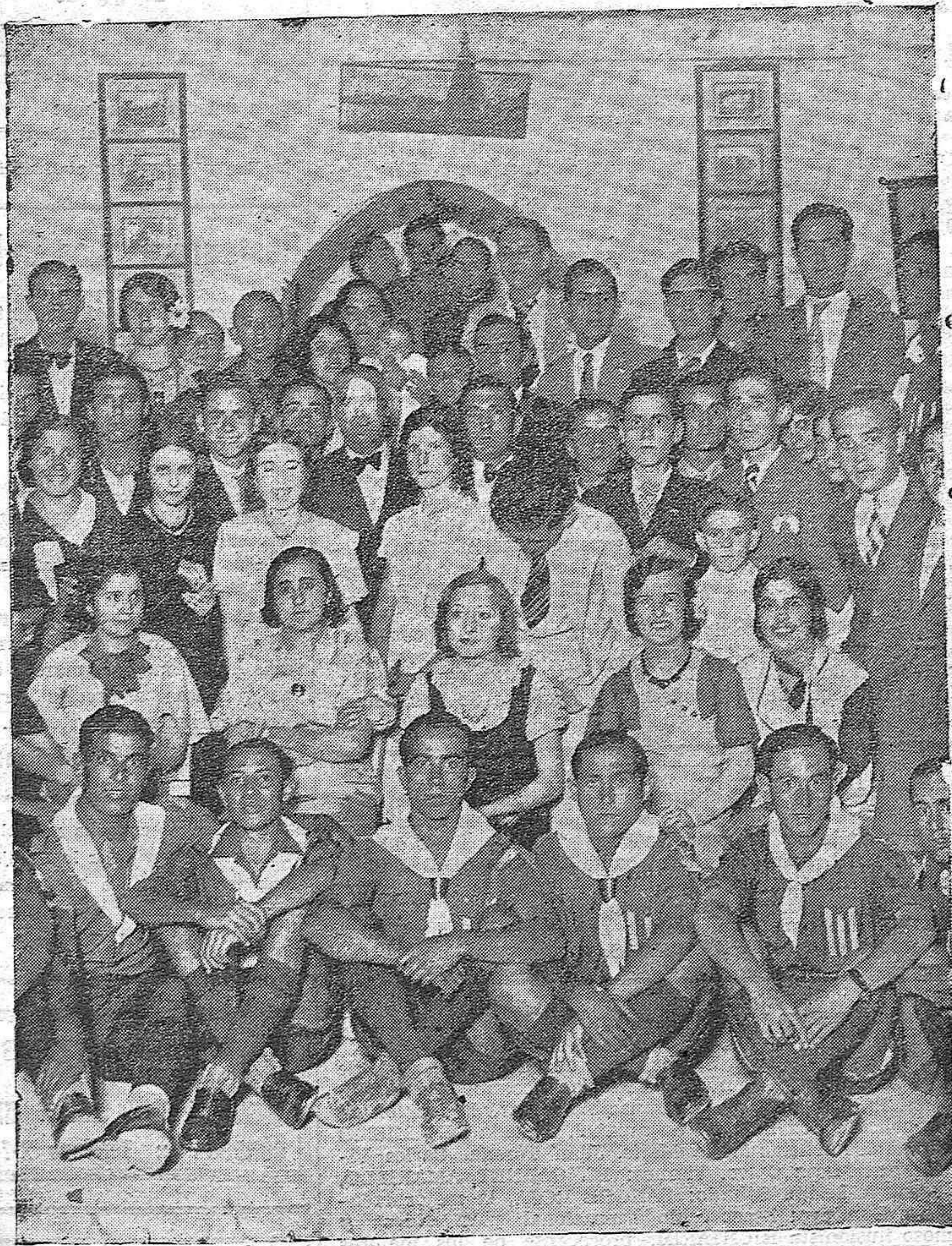
ACTUALIDAD GRAFICA.—Grupo de asistentes a la verbena celebrada en el Club de los exploradores