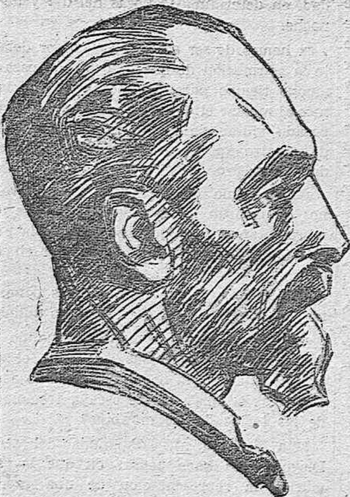
Gobernador del Banco de Inglaterra

que la crisis se convierta en catástrofe. La situación ha sido muy grave, gavisima, y lo sigue siendo, según palabras del último discurso del canciller en la Maguncia, libertada. Son muchos e importantes los problemas planteados en la nación alemana. La deuda exterior, enorme y a breve plazo; el excesivo censo de población en un país poco rico; más de cuatro millones de obreros en paro forzoso; la amenaza roja, que son los comunistas, y por si fuera poco, el auge, cada día más, de los ultranacionalistas, ante la exasperación de las masas. Son problemas que pierden la fe de cualquier hombre, por su aspecto de indisolubles, y no obstante el canciller Brüning sigue impertérrito su ruta trazada con energía. El ha dicho que todos los problemas acumulados en el transcurso de varios años, han de ser resueltos en poco tiempo, y a ser posible, en pocas semanas. El canciller, si quiere salvar a su patria, ha de encontrar solución para todos los problemas gravísimos que hemos enumerado anteriormente y no podemos ignorar que cada uno de por sí, necesitan la habilidad y el talento de un gran hombre, de un estadista. La Historia no cita hasta hoy el caso de que un solo estadista haya tenido que enfrentarse él sólo, de tantos y tan graves asuntos a la vez.