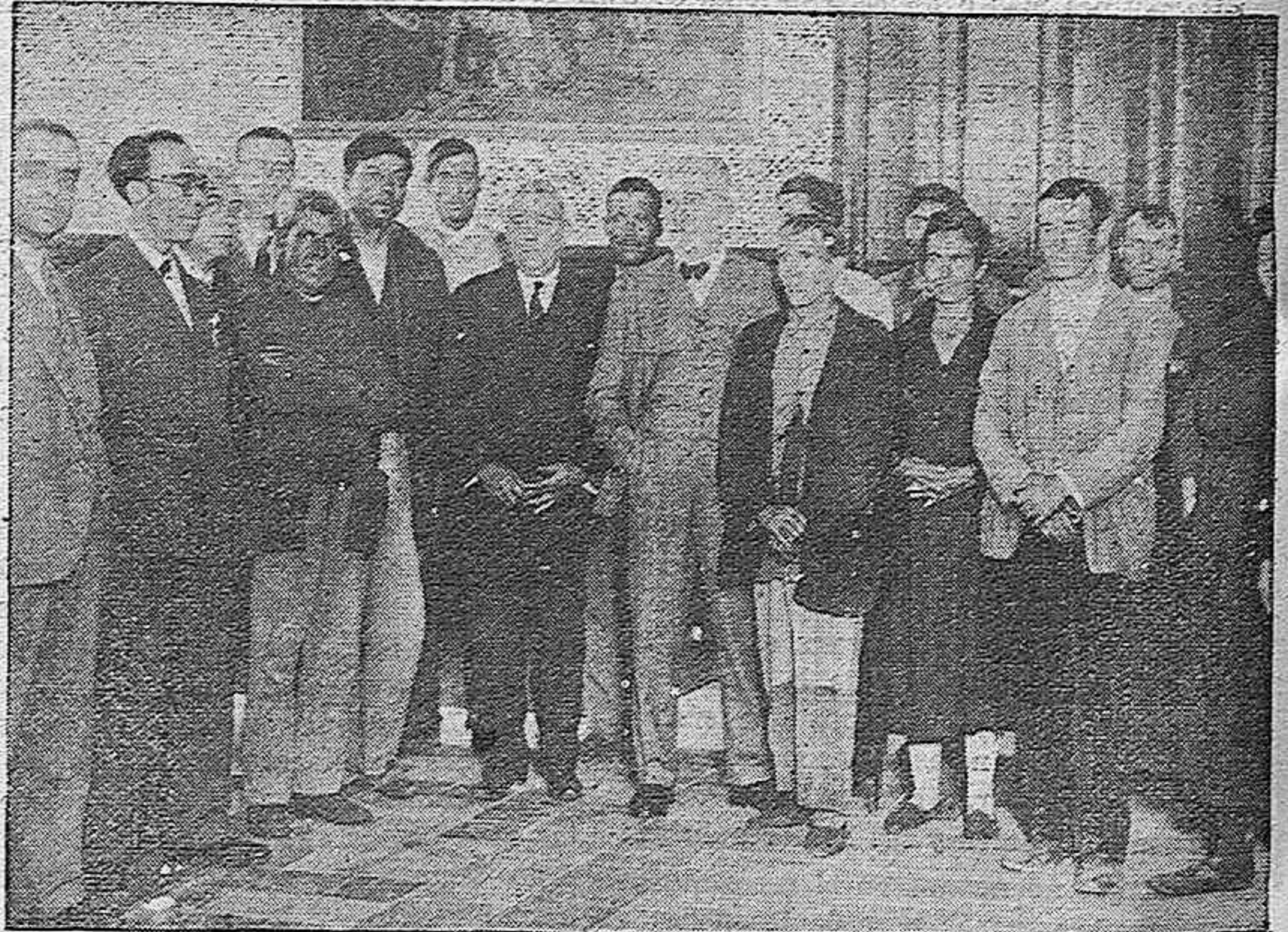
EN EL GOBIERNO CIVIL.—El gobernador civil señor Valera, con los damnificados en el incendio ocurrido en el Arroyo de Pedroches, después de la entrega de la suscripción abierta por don Manuel Zaragoza, para socorrerlos.