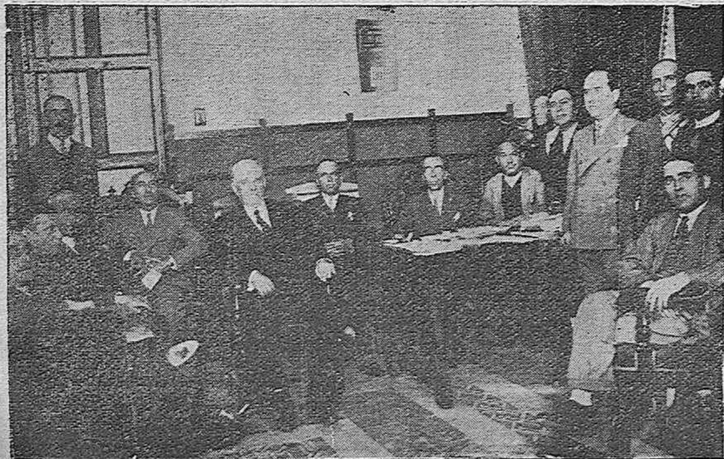
El Jurado Mixto Rural en la sesión celebrada para acordar las bases de trabajo en las faenas agrícolas.

ANTES: de comprar cortes de traje para caballero, recuerde que en EL METRO y en sus Sucursales hay gran surtido a 15, 18, 21, 24, 27, 30, 33, 36, 39, 42, 45, 50 y 60 pesetas el corte con tres metros