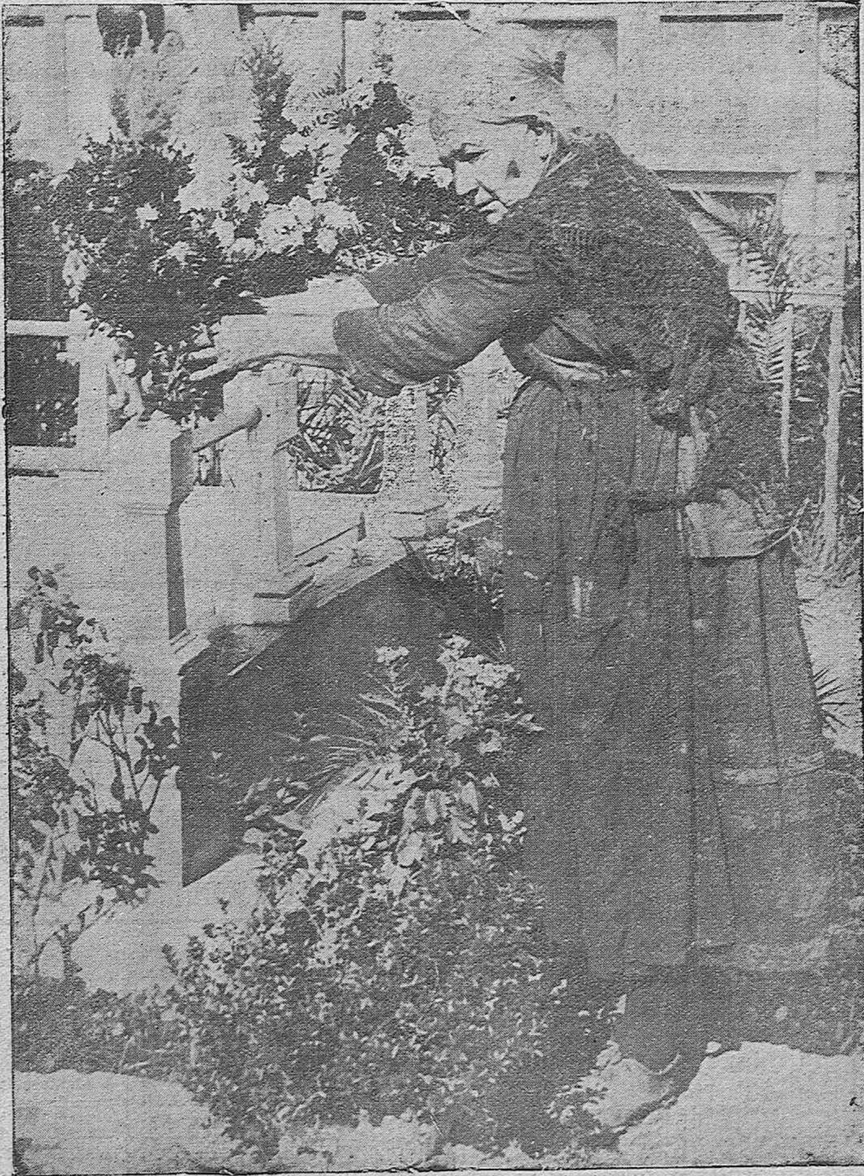
EL DIA DE LOS MUERTOS.—Esta anciana del Alcázar viejo, subviene a sus pocas necesidades con la caridad de aquellos a quienes limpia las sepulturas de los suyos durante el año y ayuda al adorno para el día de los difuntos.