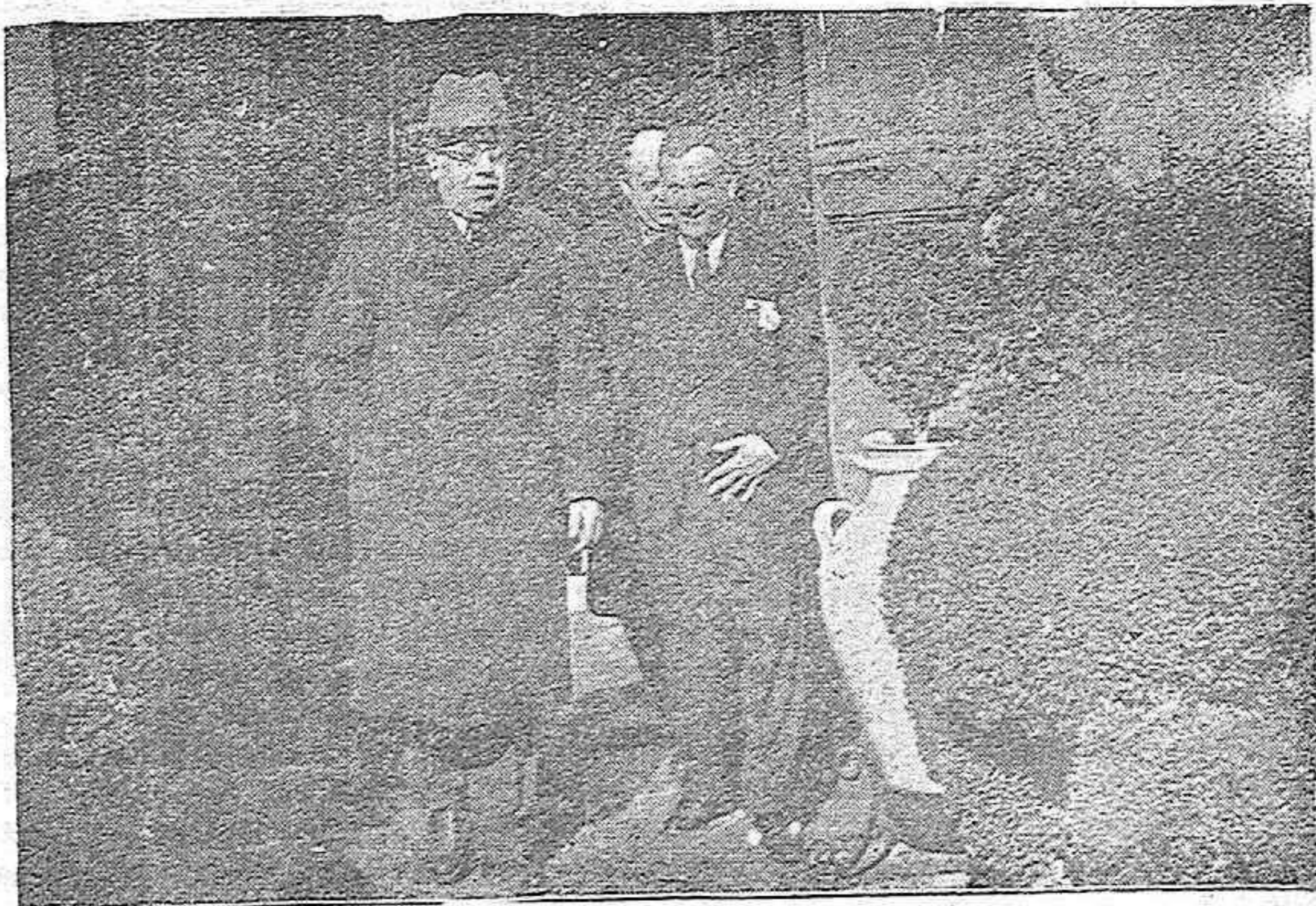
LA ESTANCIA EN CORDOBA DE DON MANUEL AZAÑA.—El presidente del Consejo con el Delegado de Bellas Artes, señor Romero de Torres, en su visita al Museo de Pinturas.

El presidente quedó encantado de ambas excursiones.