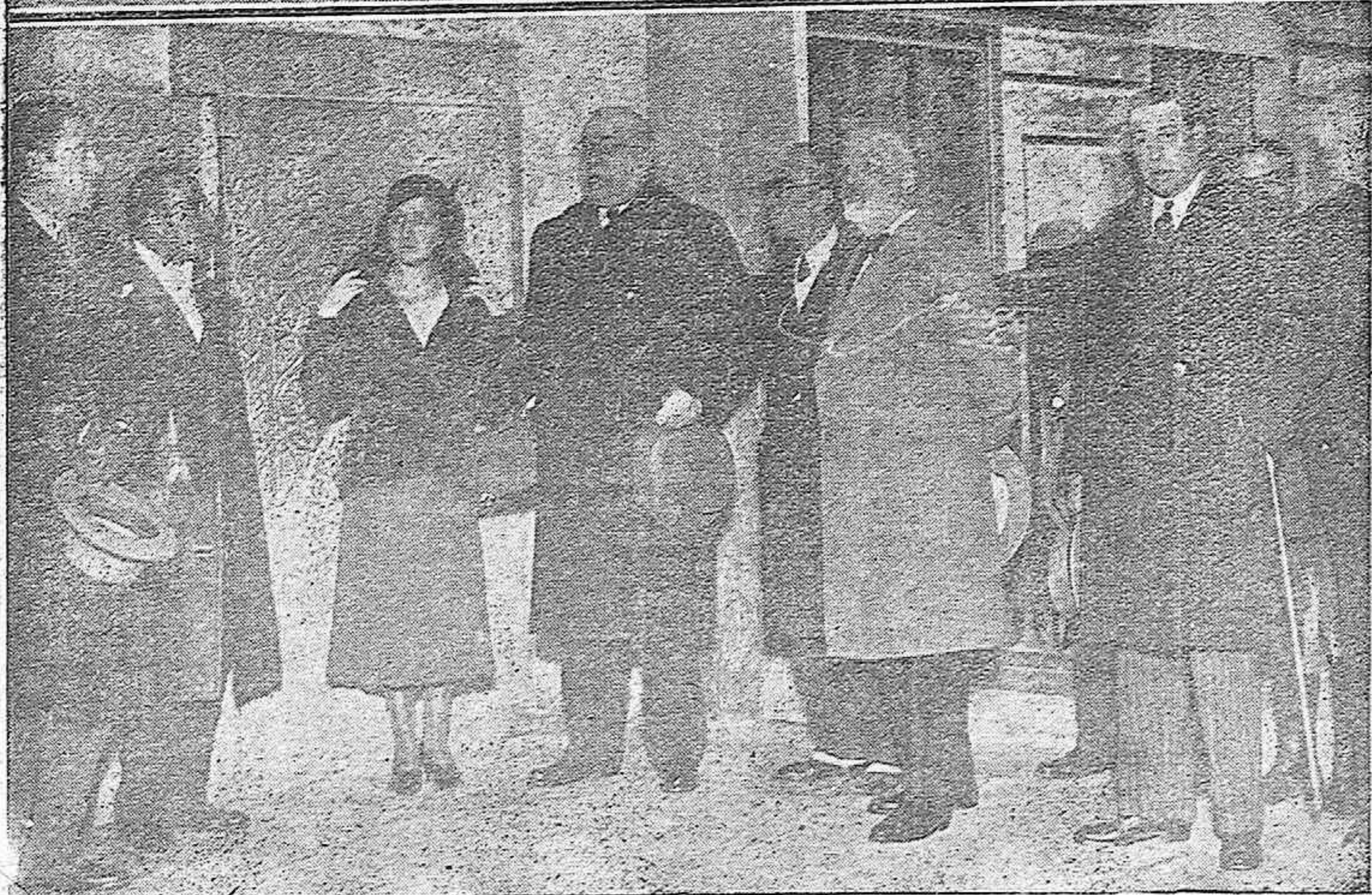
EL JEFE DEL GOBIERNO EN CORDOBA.—El señor Azana acompañado del Gobernador civil a su llegada a La Mezquita.—El Jefe del Gobierno, con su joven y bella esposa y personalidades que lo acompañaron en su visita al Mirhab