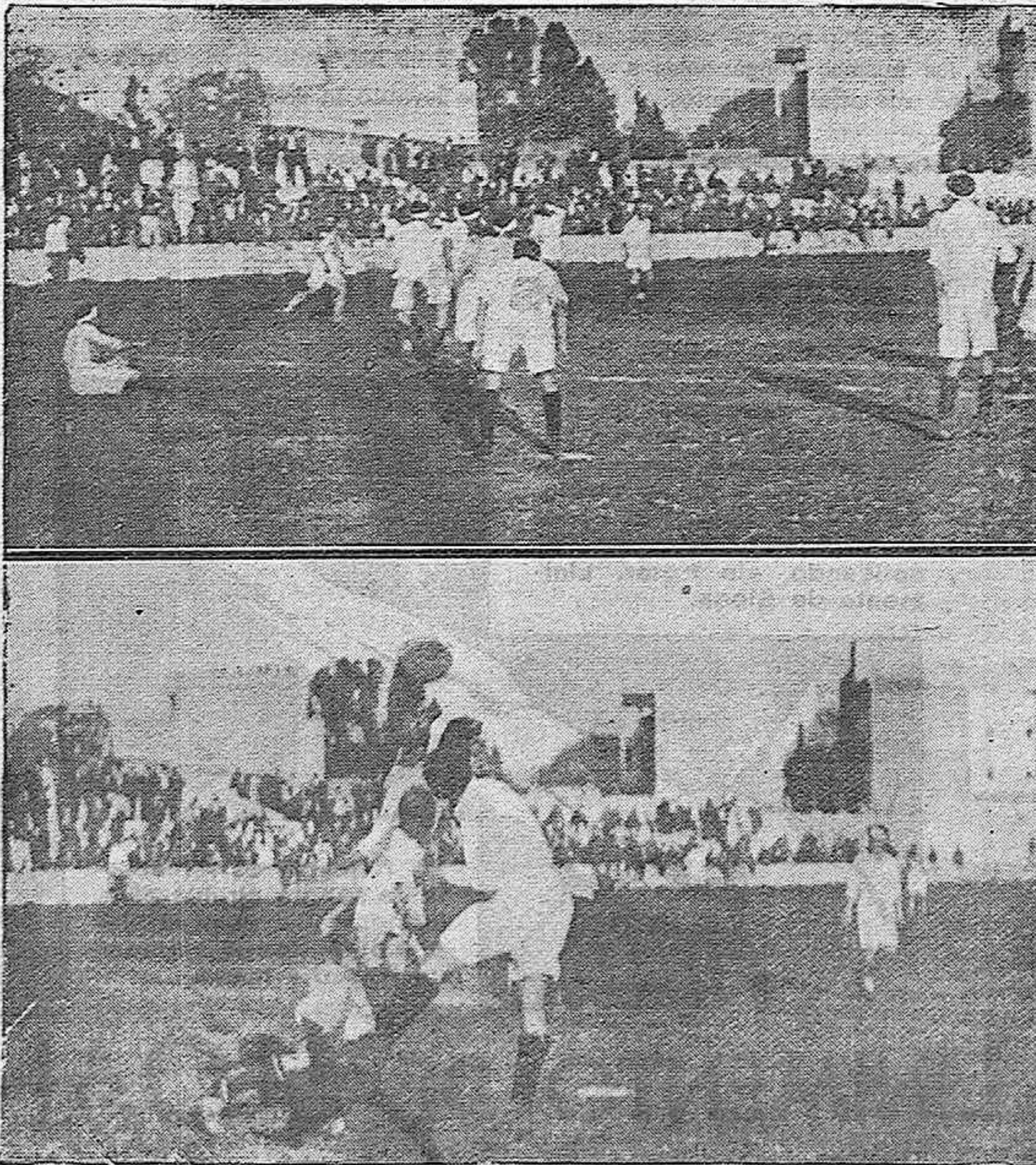
NOTAS DEPORTIVAS.—Dos momentos interesantes del encuentro habido ayer en el Stadium América entre los equipos Málaga S. O. y el Córdoba Racing