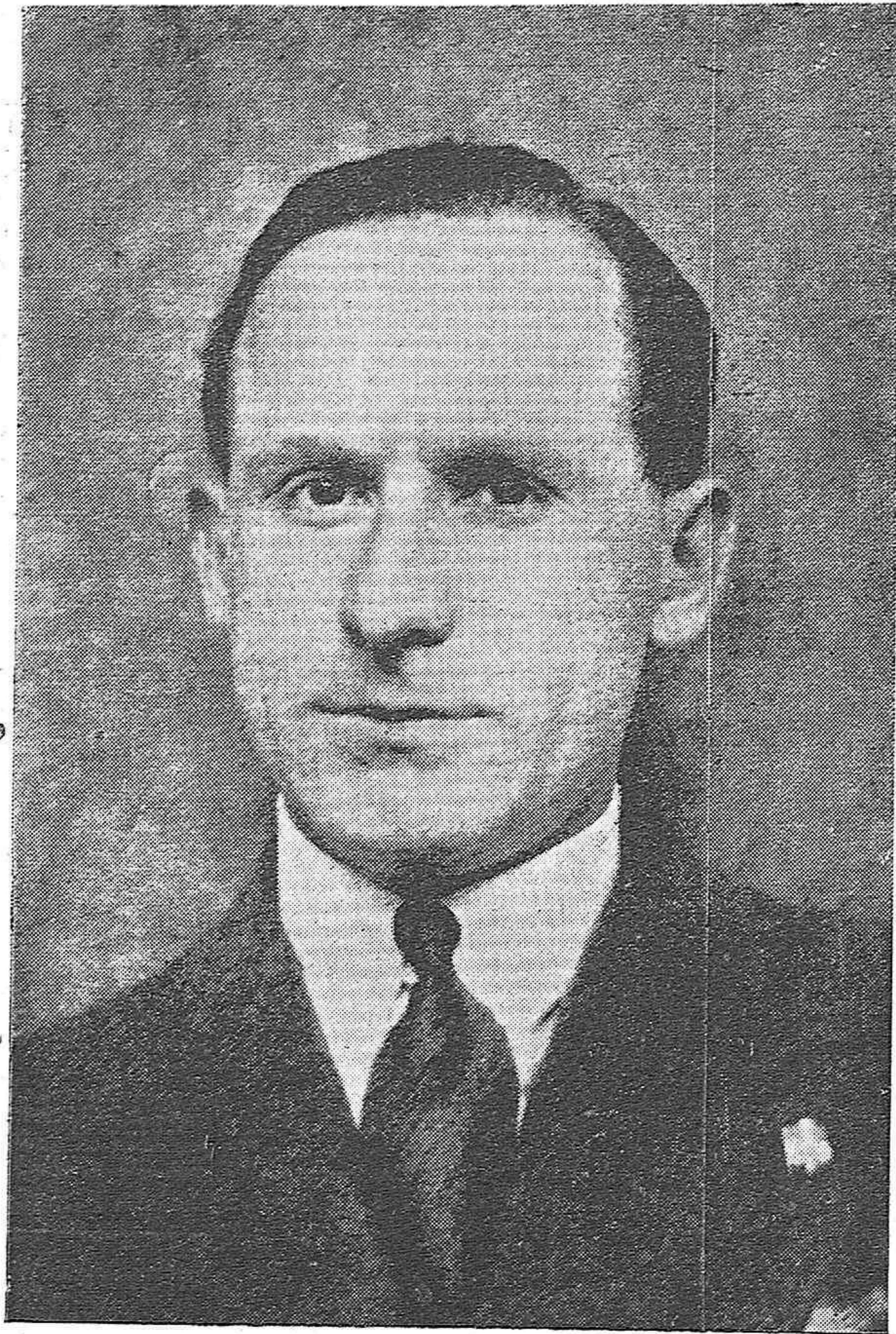
GETAFE.—EL AVIADOR Y AGREGADO NAVAL DE LA EMBAJADA DE ITALIA EN ESPAÑA, FILIPPO MONTI, QUE SE MATÓ AYER MIENTRAS PRACTICABA ARRIESGADAS ACROBACIAS CON EL AVIÓN.