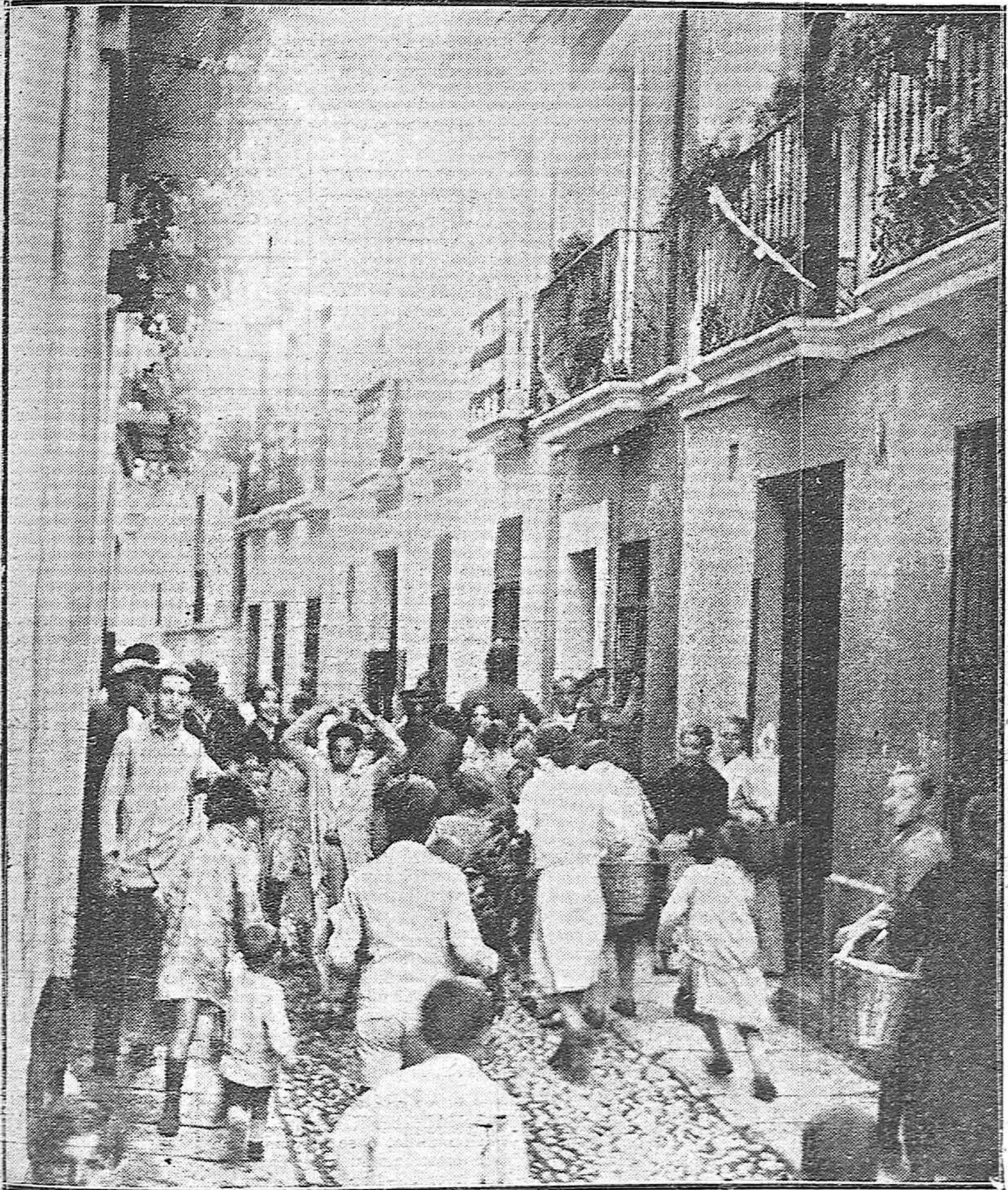
EL SUCESO DE LA CALLE CARLOS RUBIO.—LA «CASA DEL FANTASMA», ADONDE UNA MANO INVISIBLE NO CESA DE ABOYAR PIEDRAS DURANTE TODO EL DÍA, MANTENIENDO LA ALARMA DEL BARRIO Y SIN QUE LAS AUTORIDADES LOGREN DESCHIFRAR EL MISTERIO.