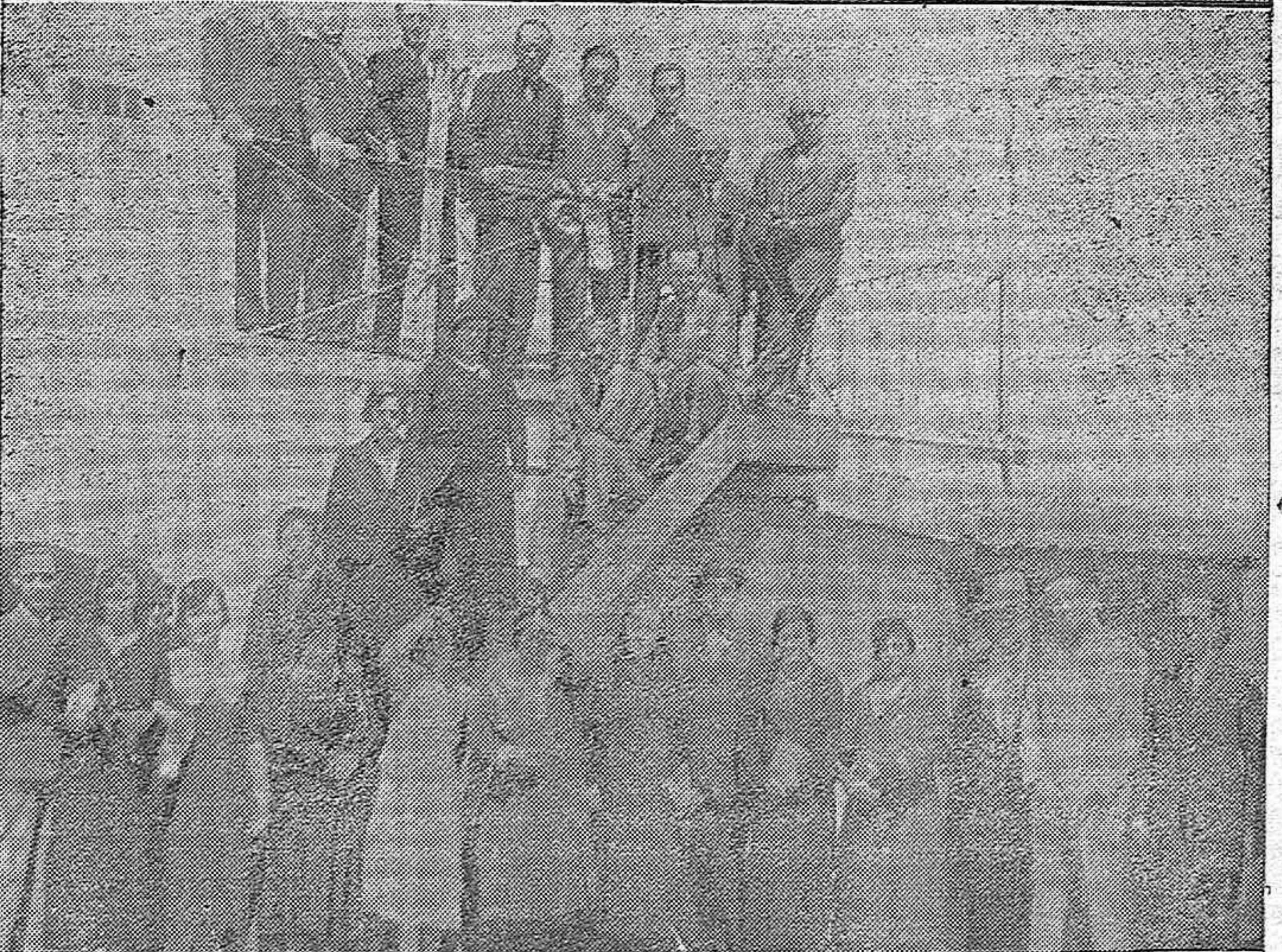
DOS NOTAS DEL CURSILLO PROFESIONAL DE MAESTROS. —Grupo de cursillistas con el Director de la Escuela Normal del Magisterio Primario y otras personalidades.—Una lección práctica a los cursillistas en la Estación meteorológica