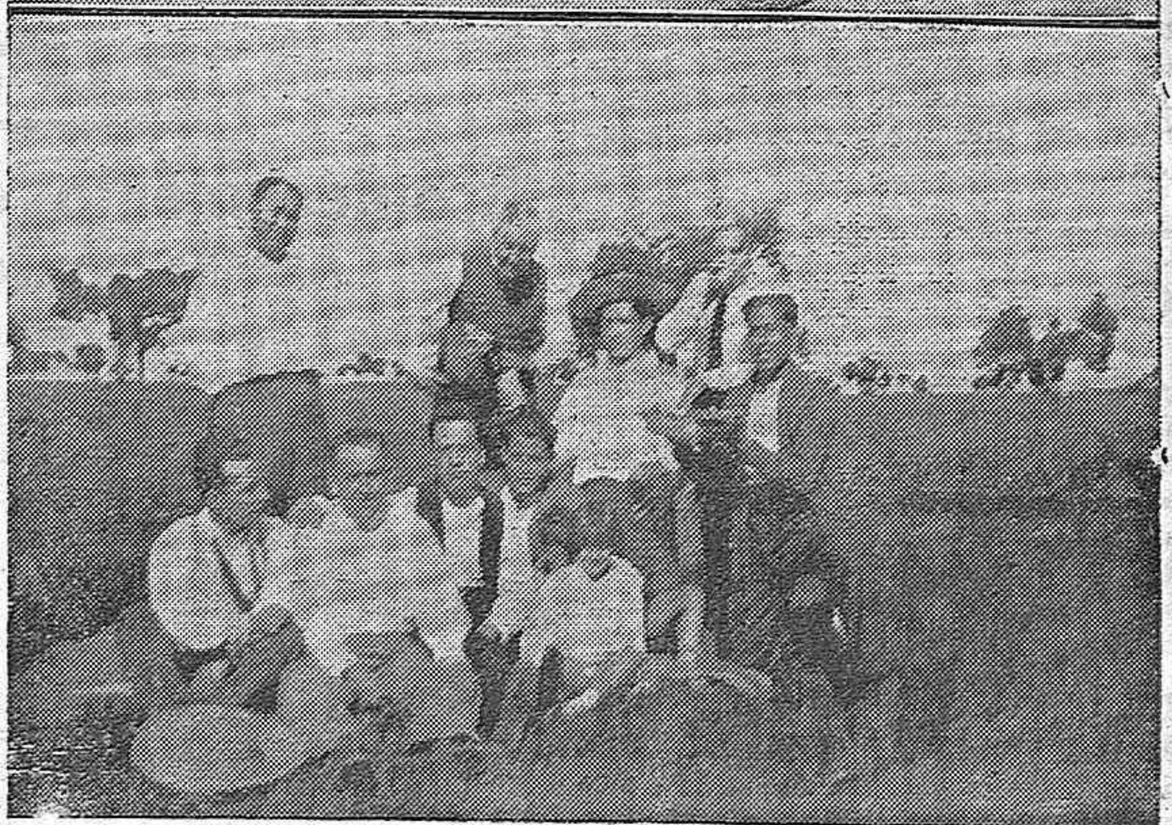
EN LA SIERRA DE CORDOBA.—Grupos de "perolistas" en la tradicional romería del Santuario de Linares.