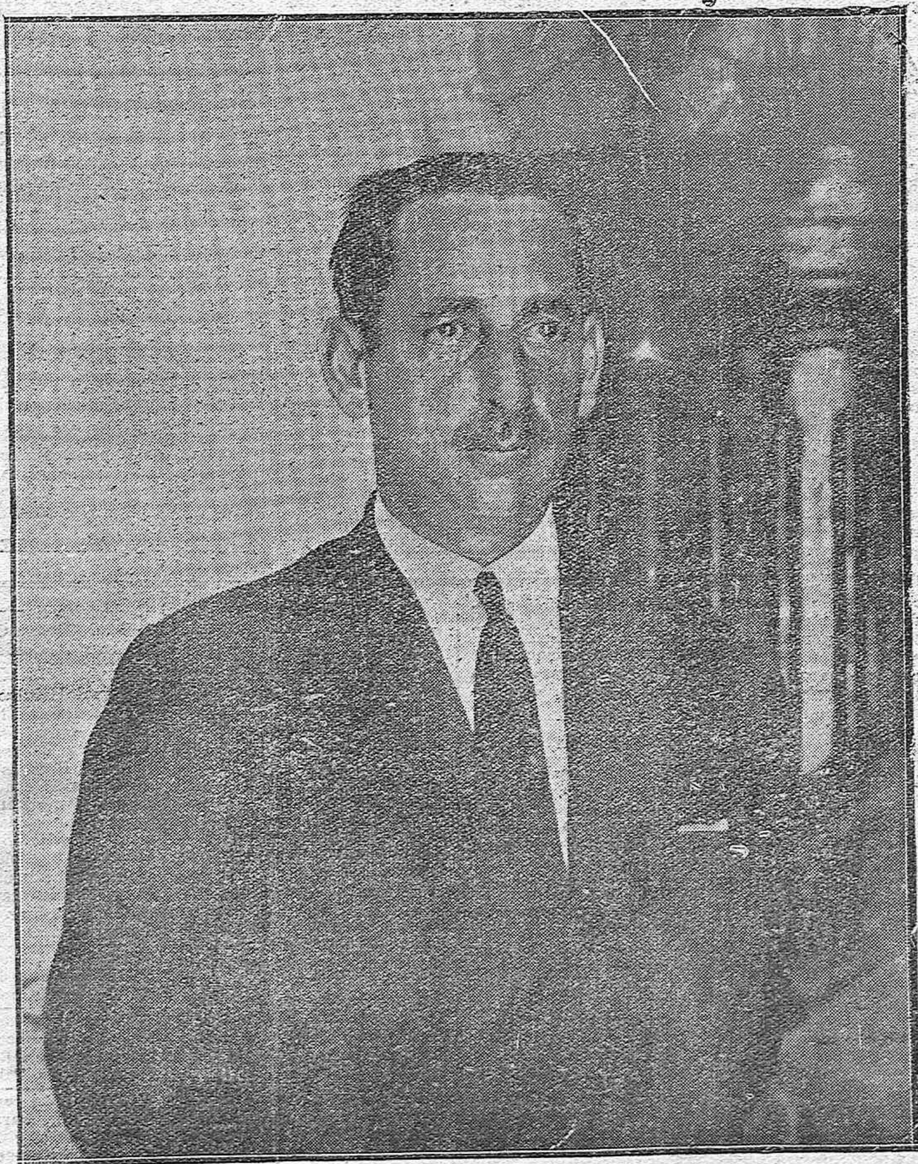
El nuevo Alcalde de Córdoba, D. José Sanz Noguera