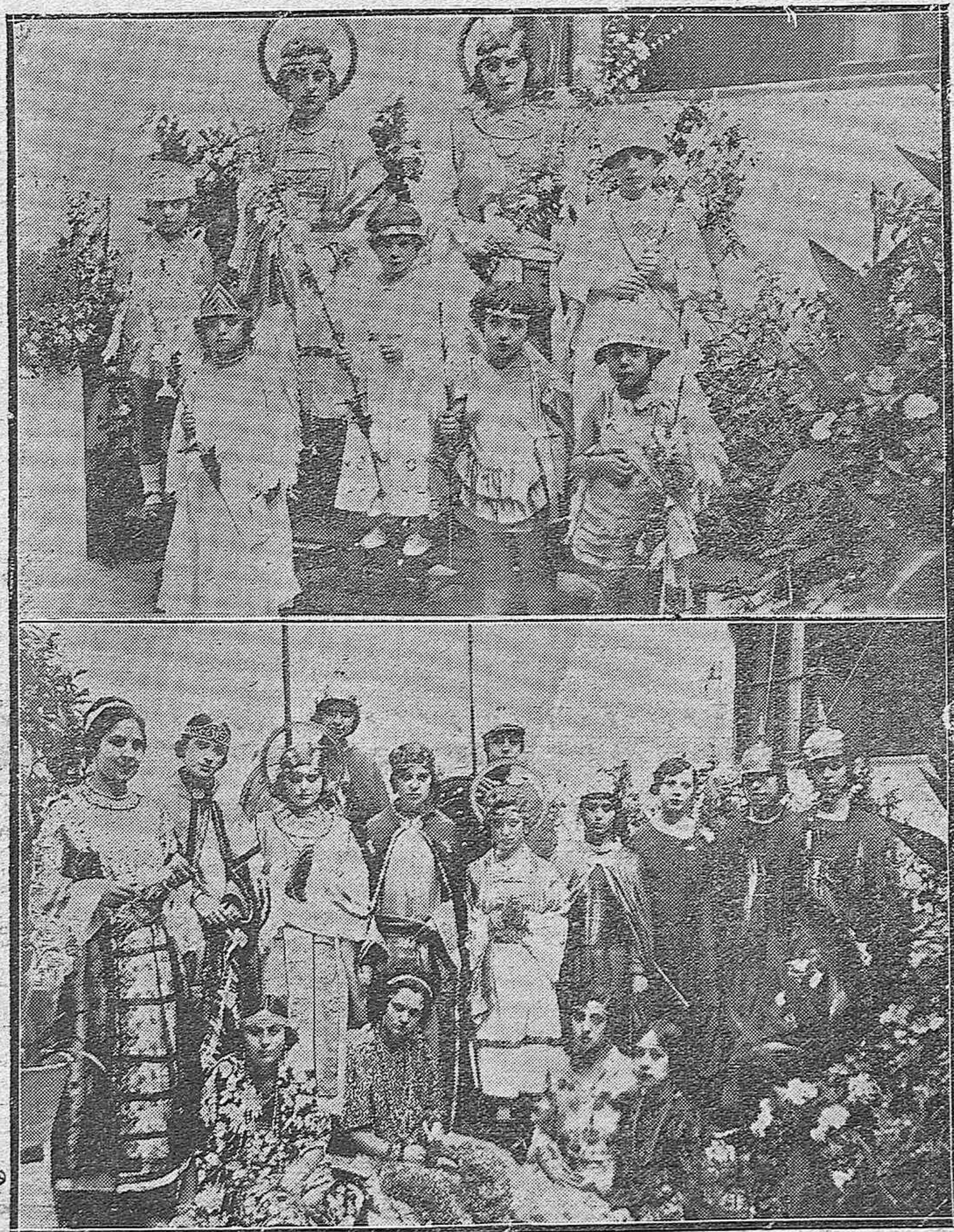
NOTAS GRÁFICAS DEL FESTIVAL EN EL ASILO DE JESÚS NAZARENO.—Niñas que presentaron un interesante cuadro plástico.—Lindas muchachas que intervinieron en la función teatral.