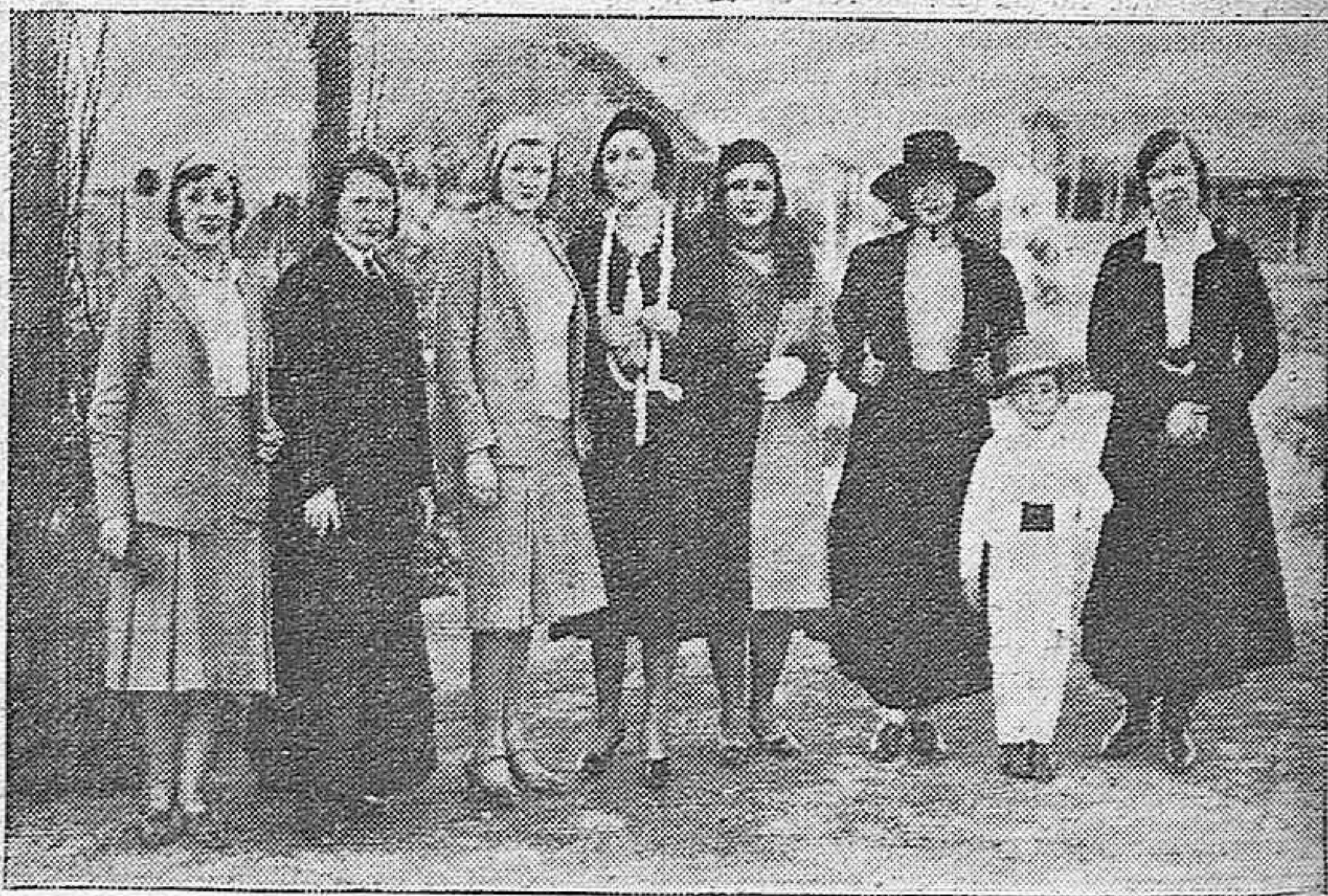
Distinguidas señoritas que concurrieron al campo de "polo" para presenciar el match de ayer.