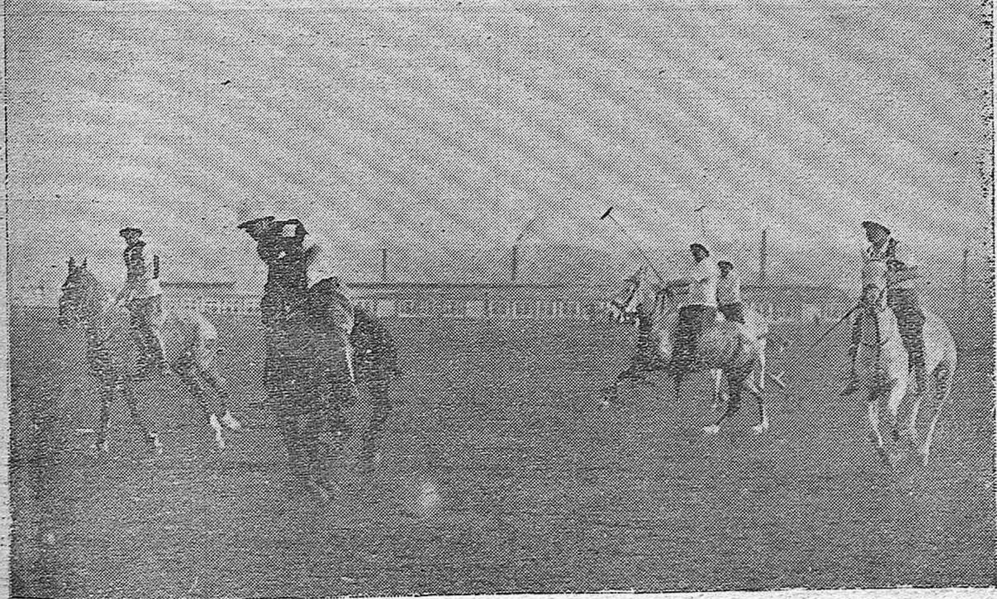
EN EL CAMPO DE POLO DE SAGUNTO.—Los equipos verde y blanco del citado regimiento que jugaron el match de ayer.—Una interesante jugada de los polistas.