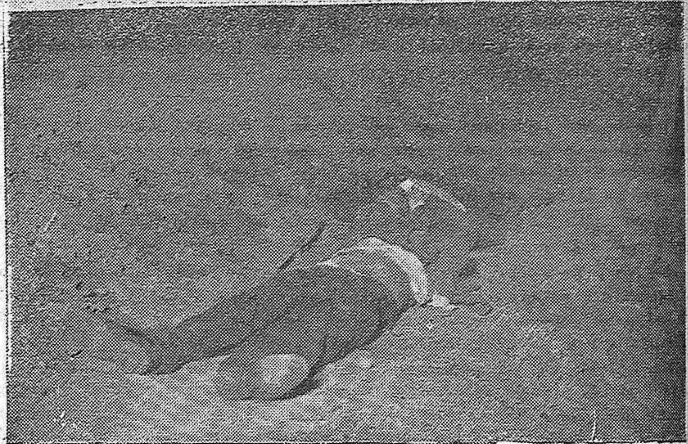
Vista del precipicio por donde cayó la camioneta, tomada desde la carretera.—Los dos cadáveres en el lugar que fueron depositados para ser más tarde trasladados a Córdoba. (Foto Torres).