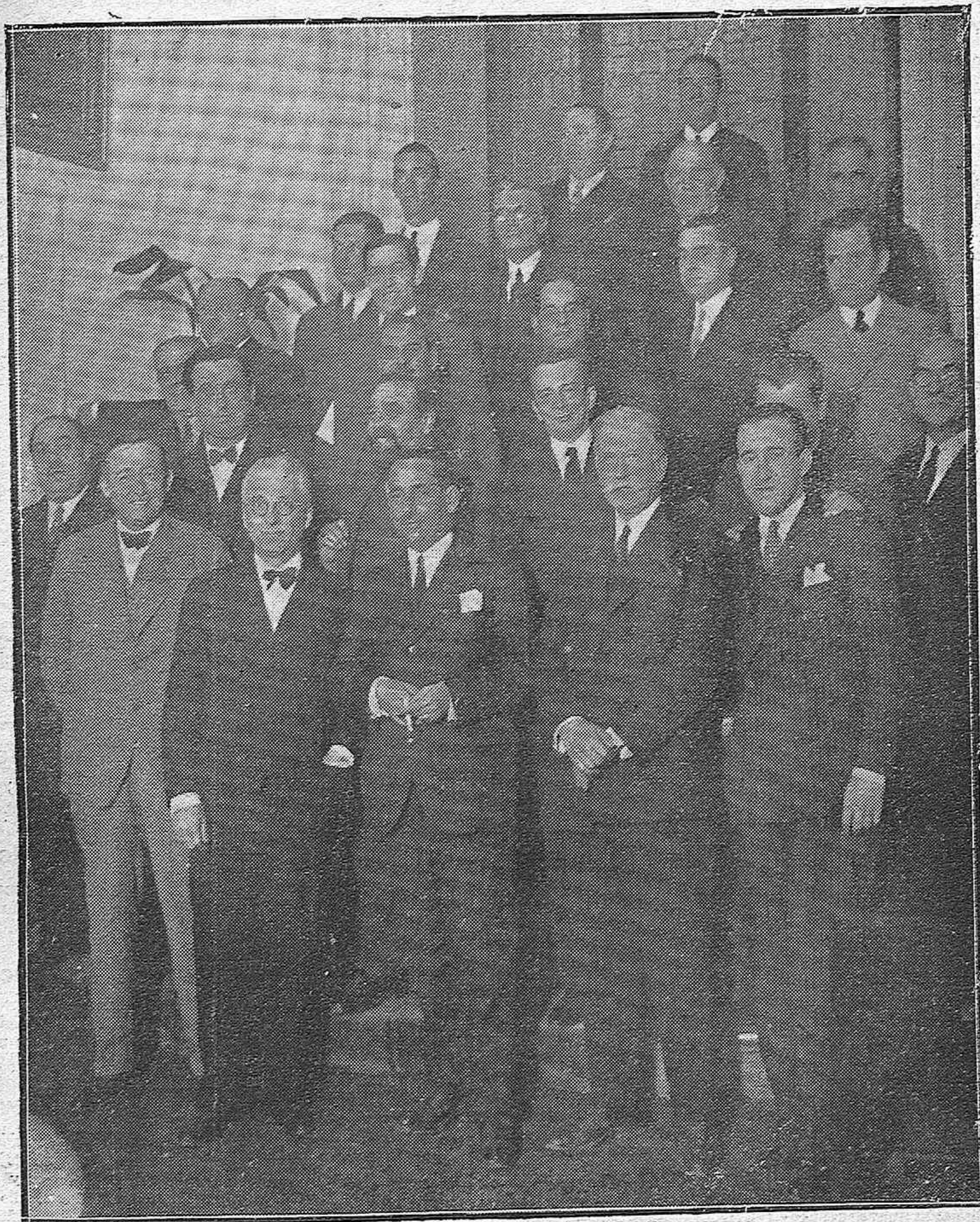
EN EL AYUNTAMIENTO.—SESIÓN EXTRAORDINARIA DEL PLENO MUNICIPAL. DONDE SE ACORDÓ REITERAR, CON CARÁCTER IRREVOCABLE, LA DIMISIÓN DEL AYUNTAMIENTO.