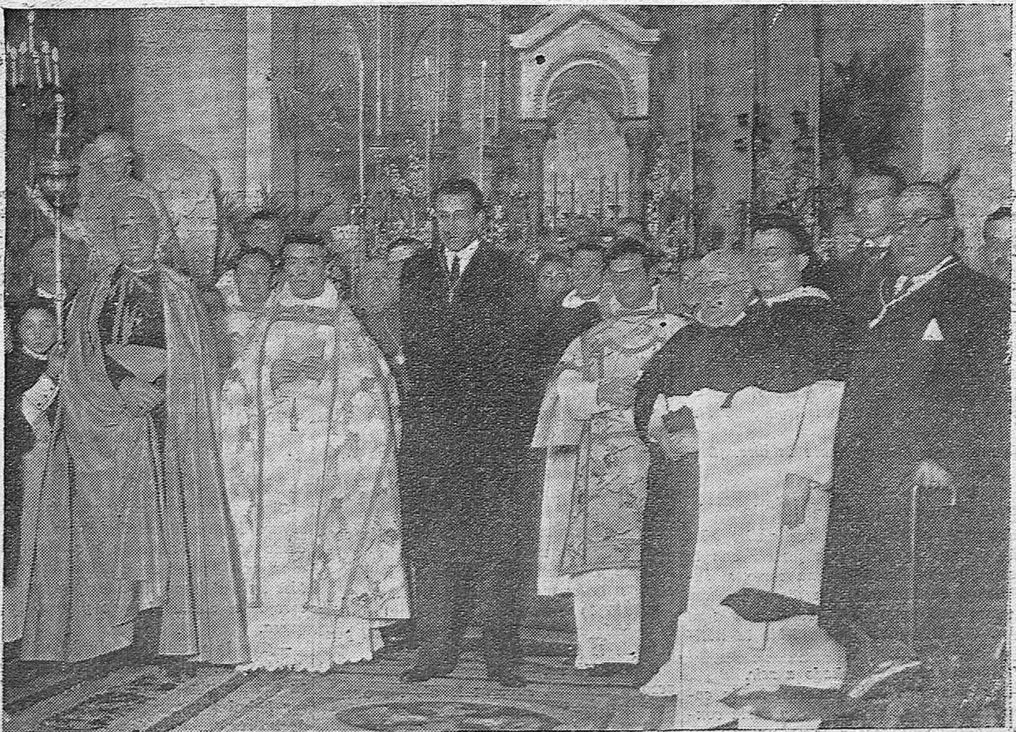
MADRID.—EN LA BASÍLICA DE ATOCHA: SU A. R. EL INFANTE D. JAIME, A QUIEN LE HA SIDO IMPUESTA LA MEDALLA DE LA VIRGEN DE ATOCHA POR EL OBISPO DE SIÓN.

GANGA VERDAD: retales varias clases de telas, a una peseta el retal; lienzo moreno, fuerte, a 0'50 pesetas el metro; telas blancas, suaves, desde 0'60 pesetas, en EL METRO y sus Sucursales.