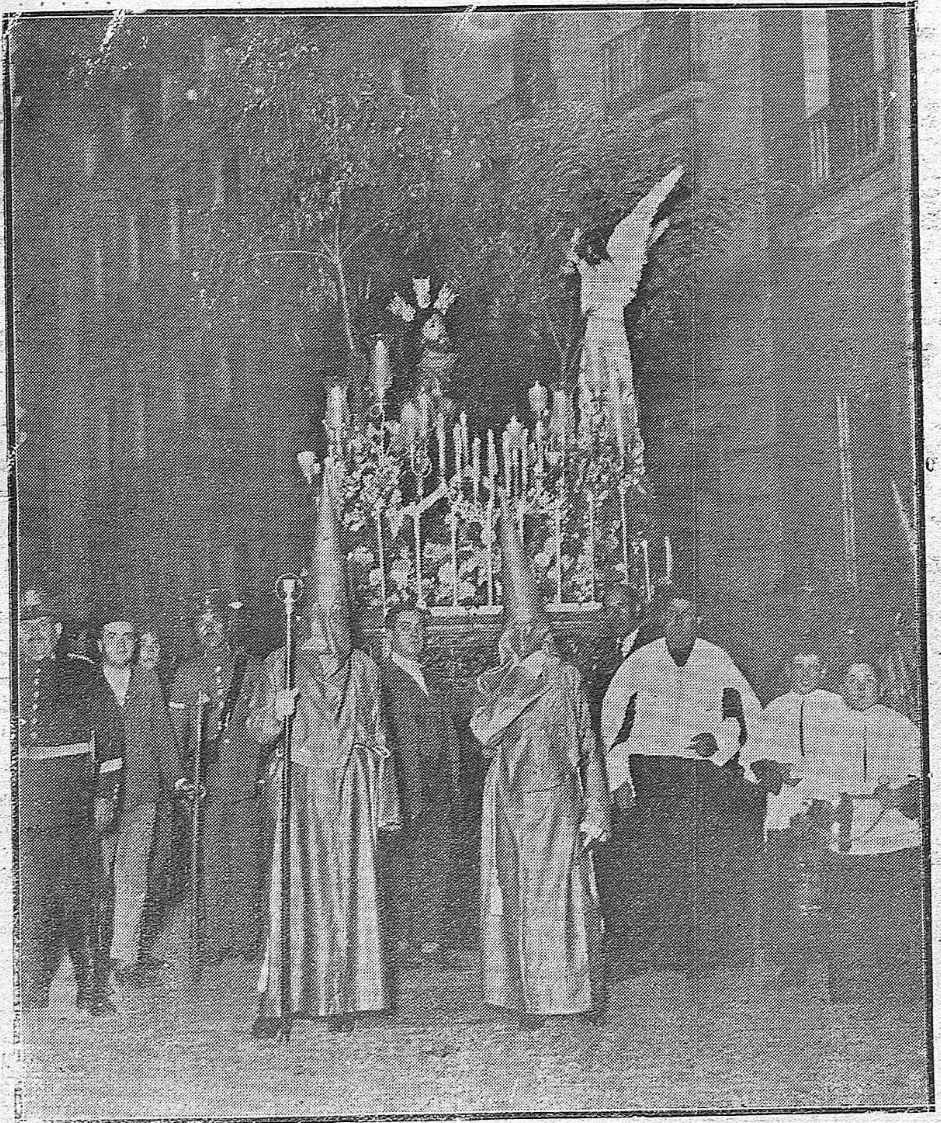
LA SEMANA SANTA EN CORDOBA.—LA PROCESION. QUE SALIÓ ANOCHÉ DE SAN FRANCISCO A SU PASO POR LA CALLE DE LA FERIA.