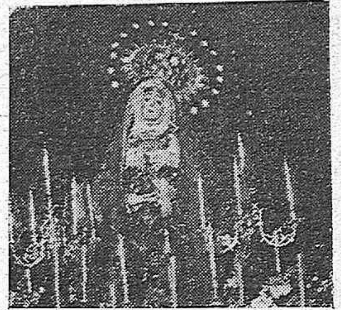
LA VENERADA IMAGEN DE LA VIRGEN DE LOS DOLOROS, QUE SALDRÁ PROCESSIONALMENTE EL VIERNES SANTO.