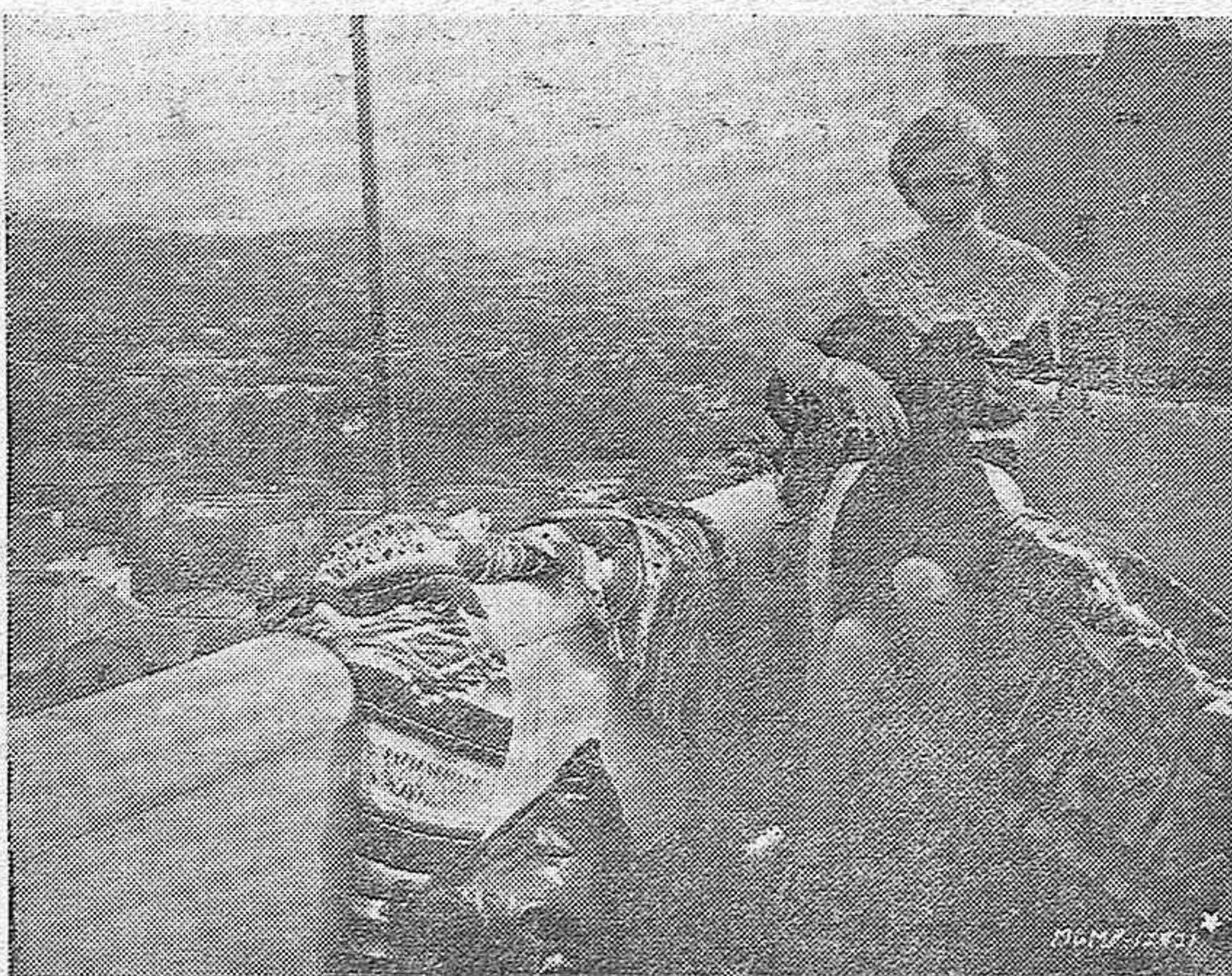
BESSIE LOVE ES UNA DELICIOSA CRIATURA QUE CONVIENE A CUALQUIER CIUDADANO CASADERO, POR LO ECONOMICA. SU GUARDARROPA LLAMA LA ATENCION EN LOS TALLERES DE CINE DE HOLLYWOOD. DOSCIENTOS PARES DE ZAPATOS, CIENTO CINCUENTA VESTIDOS, NOVENTA ABRIGOS, TRESCIENTOS SOMBREROS Y CIENTO DIEZ PARES DE GUANTES. ¡CASI NADA!

EN GRANADA: Kiosco «La Prensa», Puerta Real.—Acera del Casino, 23.