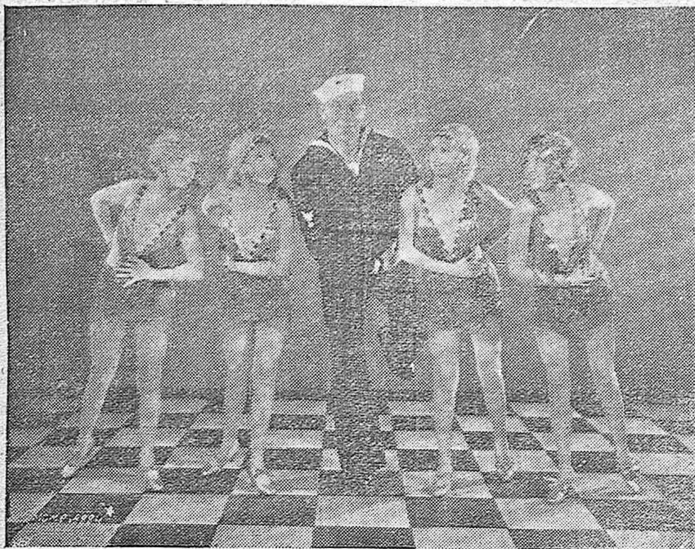
LA SUERTE NO ES PARA QUIEN LA BUSCA. HE AHÍ AL GRAN ACTOR CINEMATOGRAFICO KARL DANE, DANDO LECCION DE GIMNASIA A CUATRO «EXTRAS» DEL ESTUDIO. EL LECTOR PODRA VER LA EXCELENTE CONSTRUCCION DE ESAS CUATRO PRECIOSIDADES, PRESUNTAS ESTRELLAS DE LA PANTALLA.

Corte de María. —Los antiguos asociados y las personas votasde de la Virgen visitarán en este día, viernes 5, a Nuestra Señora del Patrocinio, en el Salvador.