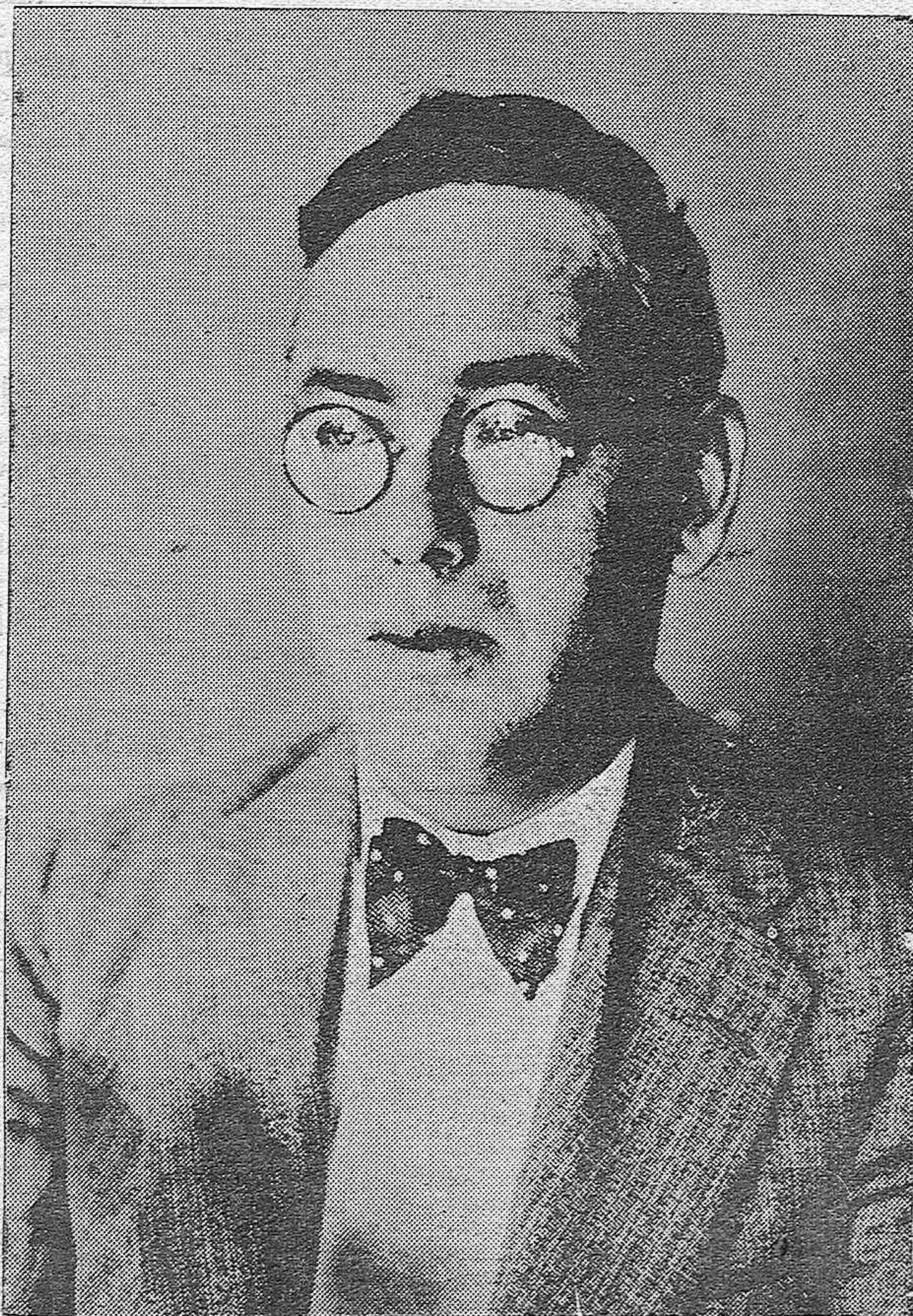
DON BLAS INFANTE, Federal andalucista, del Partido Republicano Autonomo