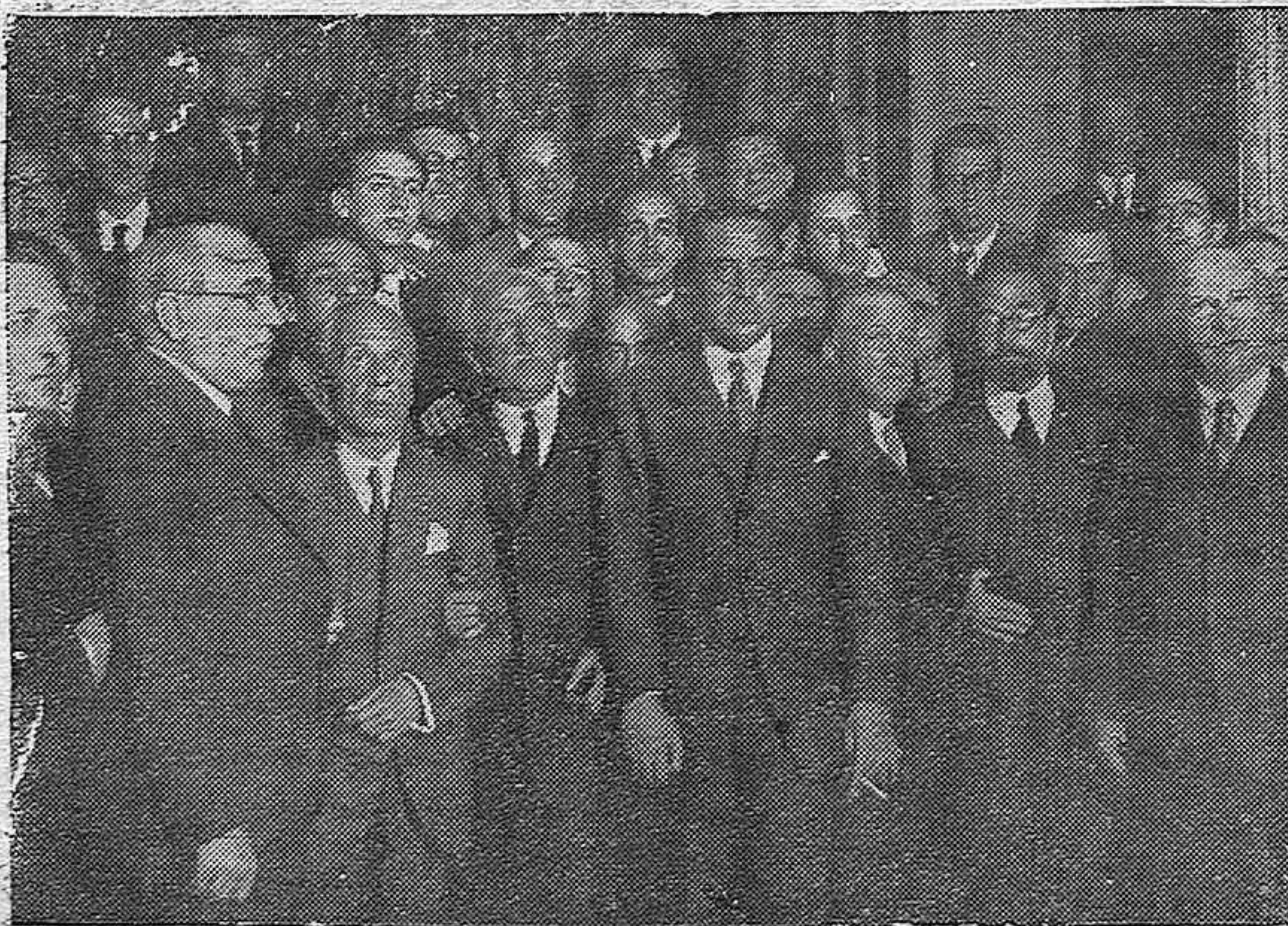
MADRID.—EN EL MINISTERIO DE LA GOBERNACION.—El Gobierno provisional de la República, después de posesionarse y haber proclamado la República en la Puerta del Sol. (Foto Alfonso).

El orden público lo primero. Luego lo demás. Y dentro de este guión rápido y vibrátil, ha de reconocerse que la tranquilidad es un hecho real. Nuevamente, hemos de recalcar, con orgullo de cordobeses, la circunspección y sensatez del pueblo, en momentos, que como el de ayer, solo la disciplina de partido y la propia disciplina moral de cada uno, eran los verdaderos agentes de la autoridad.