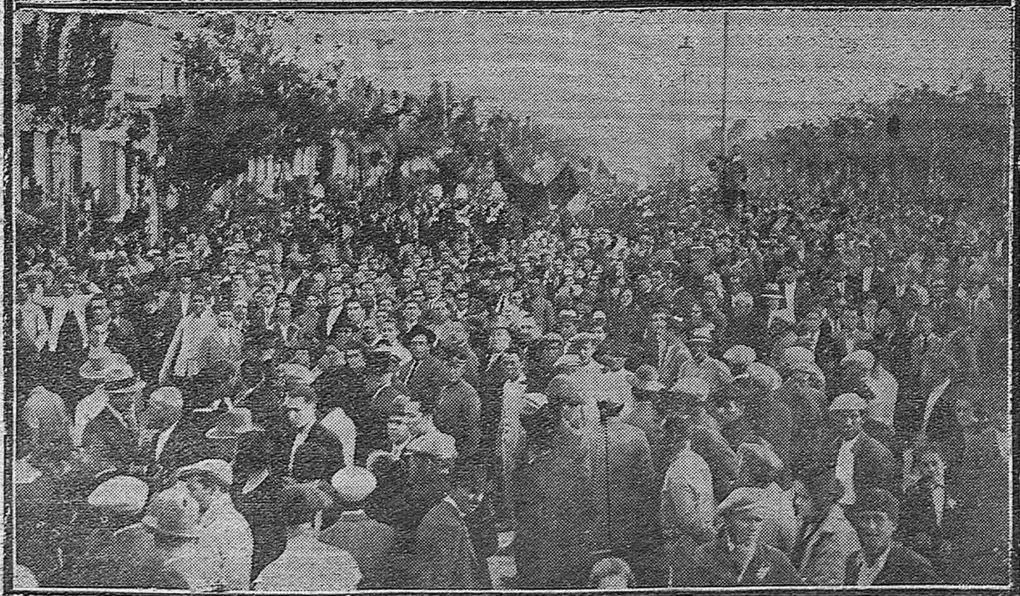
Las autoridades republicanas que presidieron la manifestación de ayer. — En primer plano se ve al Sr. Vique, alcalde republicano en marcha de la manifestación.