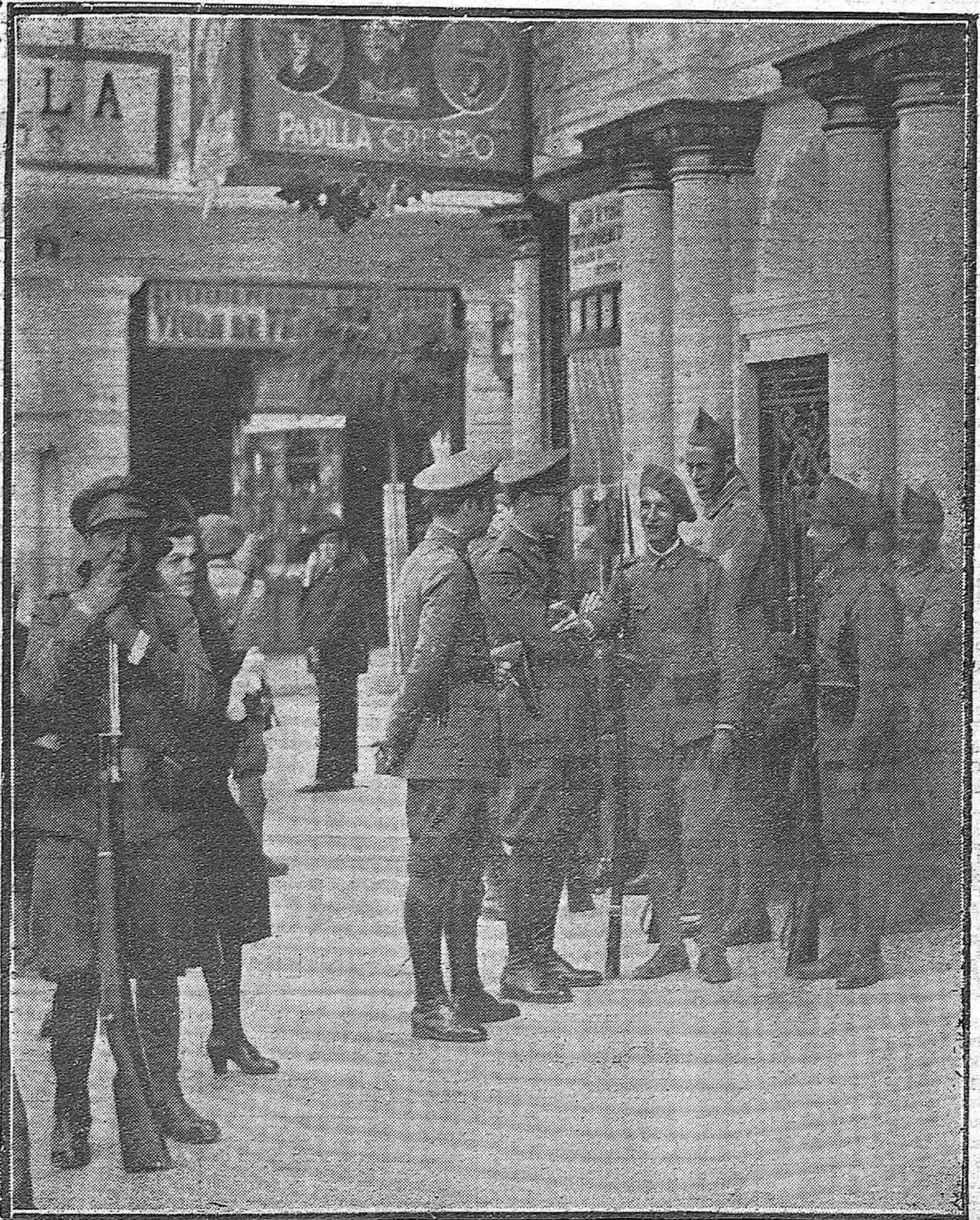
HACIA LA NORMALIDAD. —La foto revela el estado tranquilo de la ciudad; este grupo de oficiales y soldados en la vía pública es la única demostración de que nos hallamos en estado de guerra.