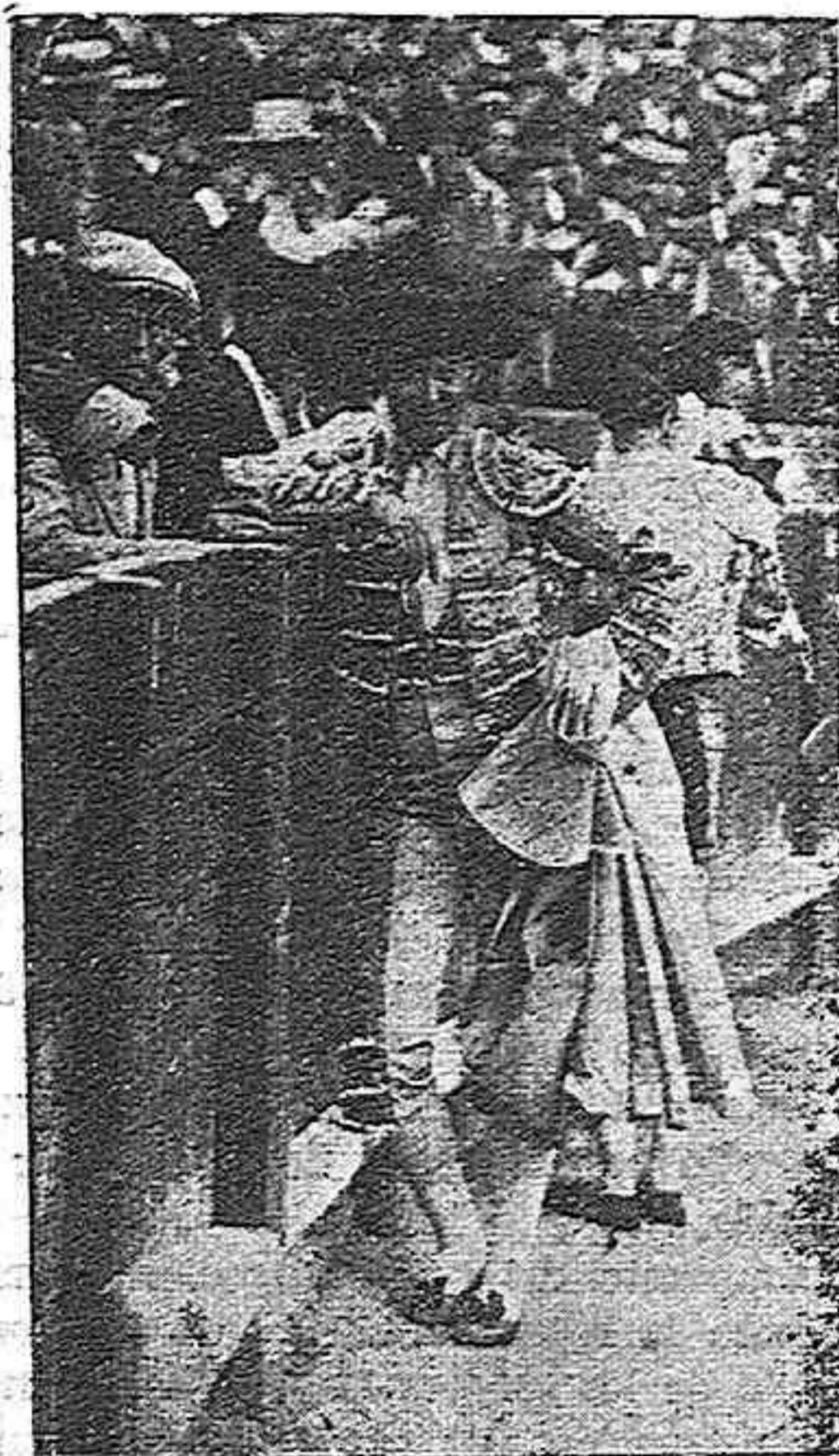
Una de las últimas fotos de Joselito, en la plaza de Madrid, pocos días antes de la tragedia

"Guerrita" habla de la muerte de Joselito Cuando Guerrita supo la noticia fué presa de gran agitación e impresionado fuerte-