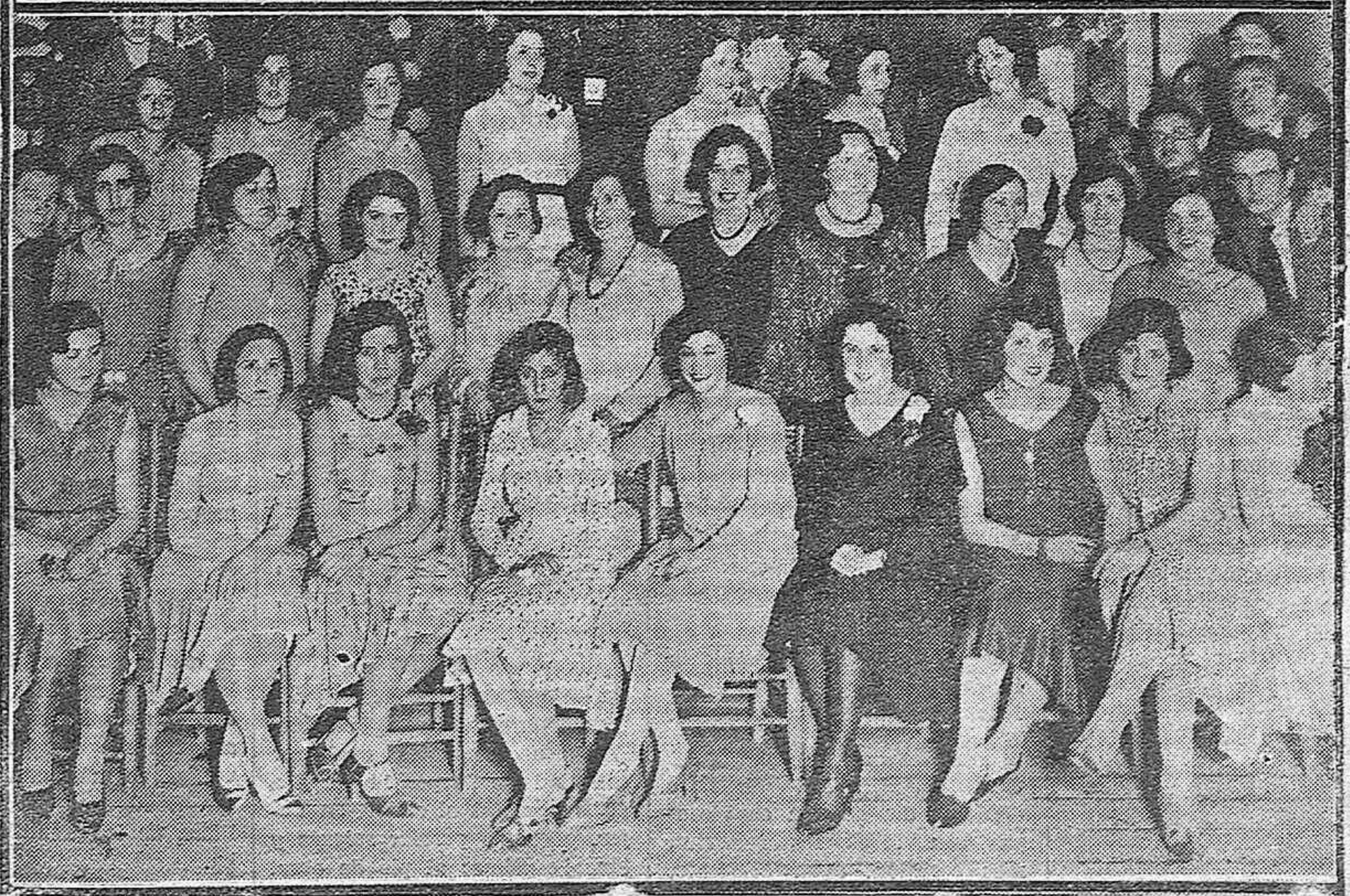
SEVILLA.—El ministro de Comunicaciones durante la recepción celebrada en el Ayuntamiento. LAS CRUCES DE MAYO.—Señoritas concurrentes a la Sociedad Artística Benavente para celebrar las tradicionales fiestas de Mayo