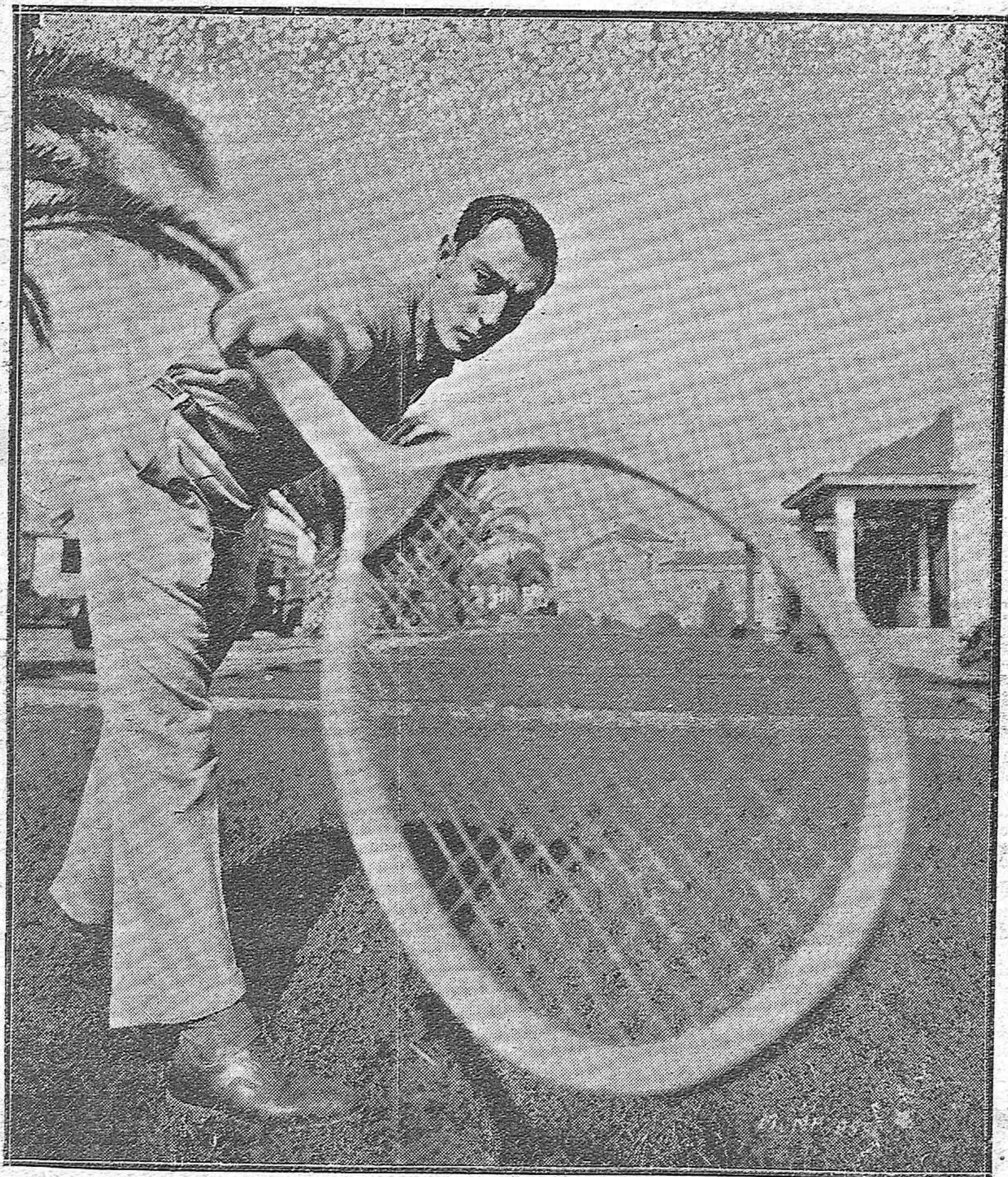
BUSTER KEATON EL GRAN ACTOR CINEMATOGRAFICO, «EL HOMBRE DE LA CARA DE HIELO», QUE SE ENCUENTRA EN CORDOBA EN VIAJE DE TURISMO