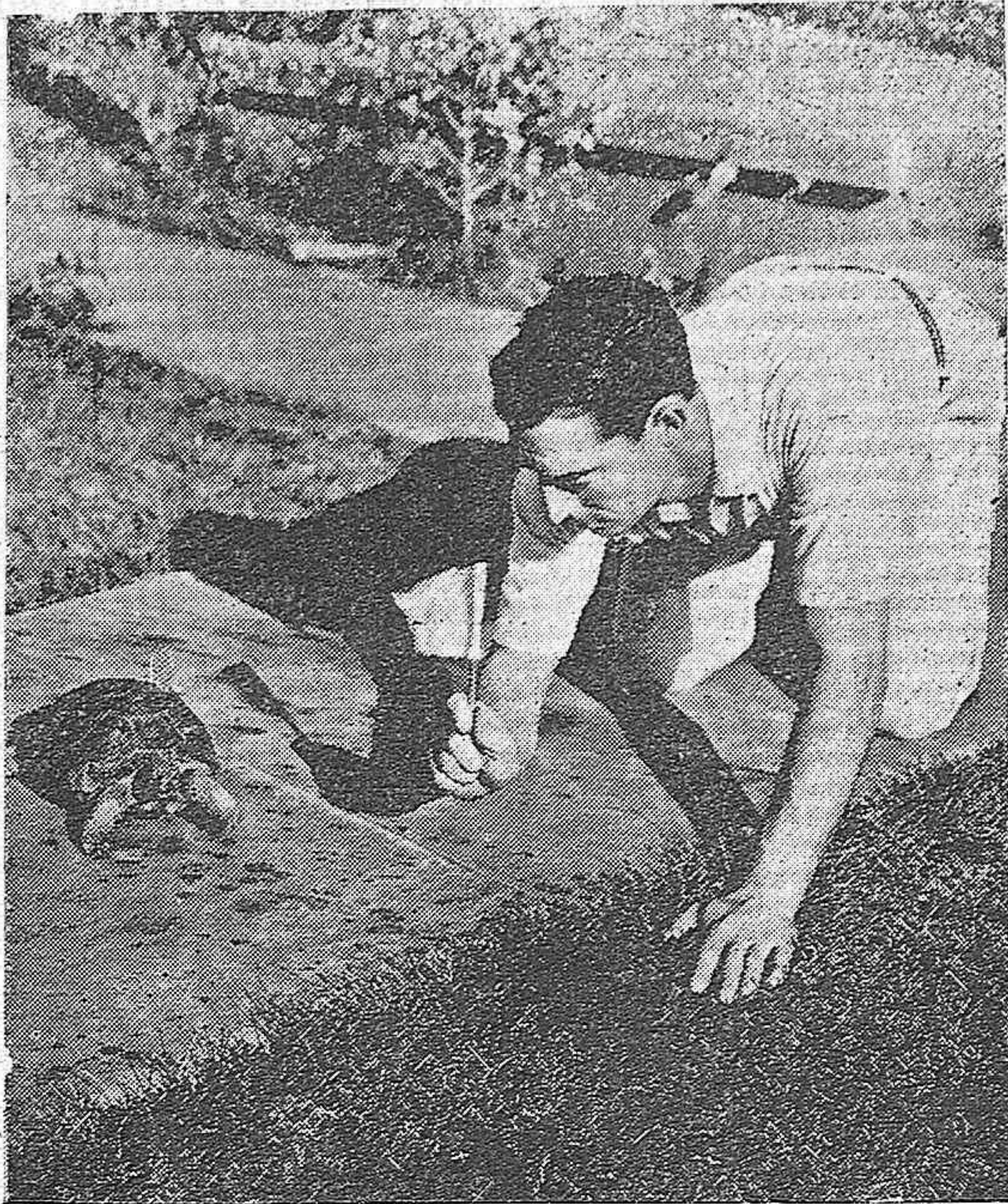
HE AHI A NUESTRO HUESPED; AL IMPERTURABLE BUSTER KEATON, ENTREGADO DURANTE LOS RATOS DE OCIO, A SU OCUPACION FAVORITA QUE ES LA DE AMAESTRAR GALAPAGOS