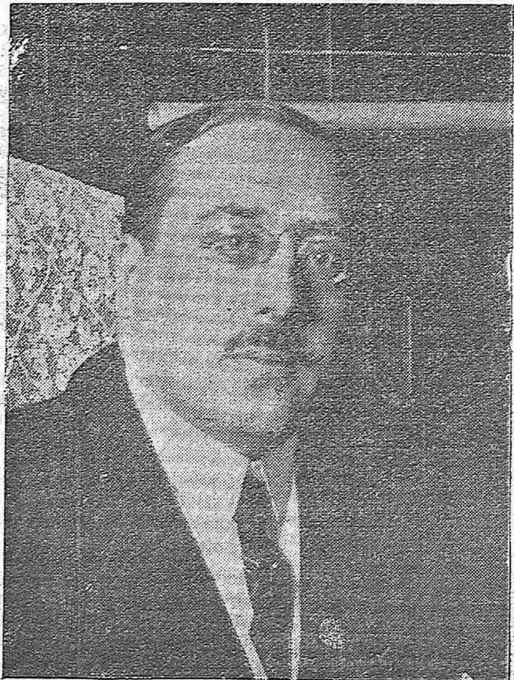
MADRID.—LA SOLUCIÓN DE LA CRISIS.—EL NUEVO MINISTRO DE ECONOMÍA, DON LUIS RODRÍGUEZ DE VIGURI.

lámparas, receptores, amplificadores Cruz Conde, 4 CORDOBA