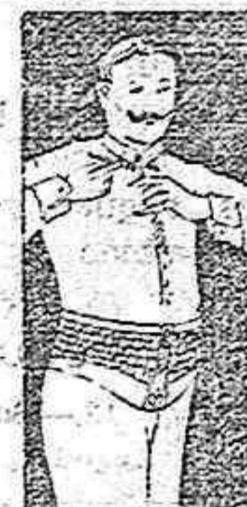
FAJA DE CABALLERO