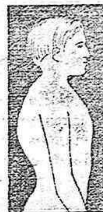
MAL DE POTT