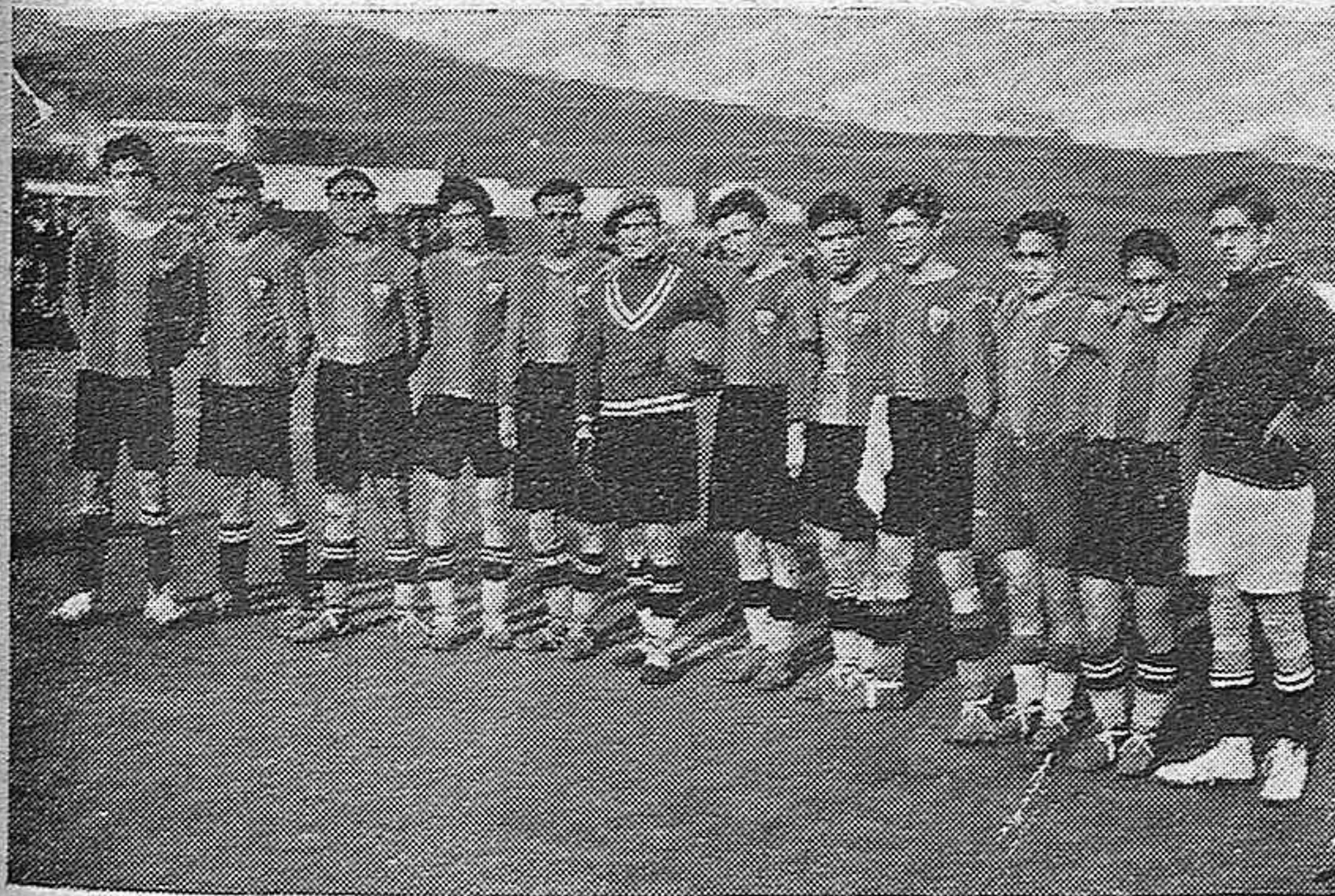
CLUB DEPORTIVO DE PUEBLONUEVO.—EQUIPO QUE GANÓ EL CAMPEONATO Y COPA DE PLATA EN EL CONCURSO CELEBRADO EN AQUELLA CUENCA MINERA.