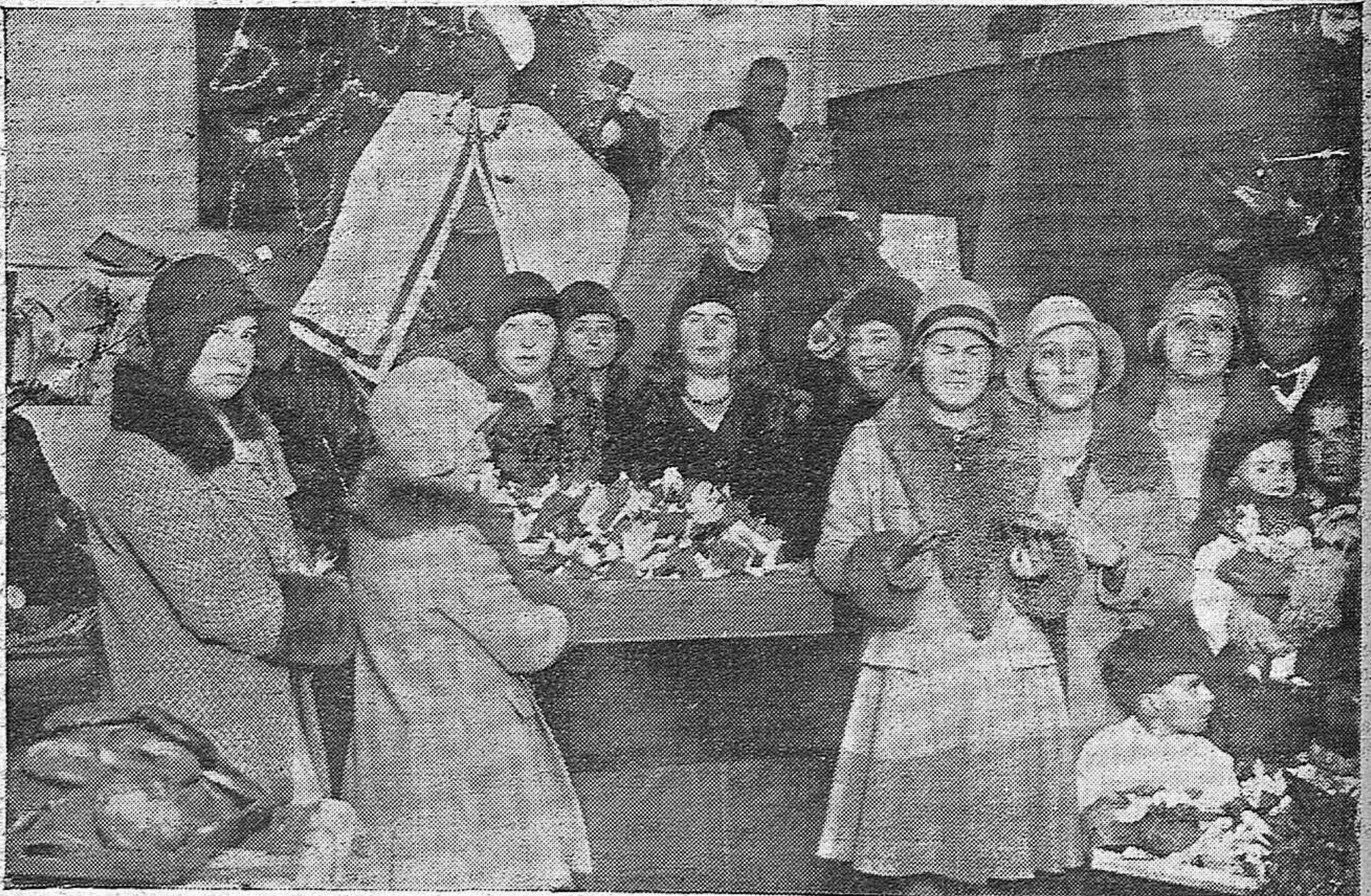
EN EL DISPENSARIO DE LA CRUZ ROJA.—REPARTO DE ROPAS Y JUGUETES A LOS NIÑOS QUE FUERON ASISTIDOS EN EL PASADO AÑO, INTERVINIENDO EN EL ACTO DISTINGUIDAS DAMAS Y SEÑORITAS.

Convengamos en que duele un poco al romanticismo y a la sensibilidad la clausura de una vieja institución, ligada tantos años a la vida diaria cordobesa. Nosotros desde nuestras posiciones sociales, nos hacemos eco de la infortunada suerte corrida por el Círculo Liberal. ¿Quién sabe si en ese cerrojazo no han tenido buena parte la ingratitud de unos, el olvido de otros y la incompreensión de muchos!