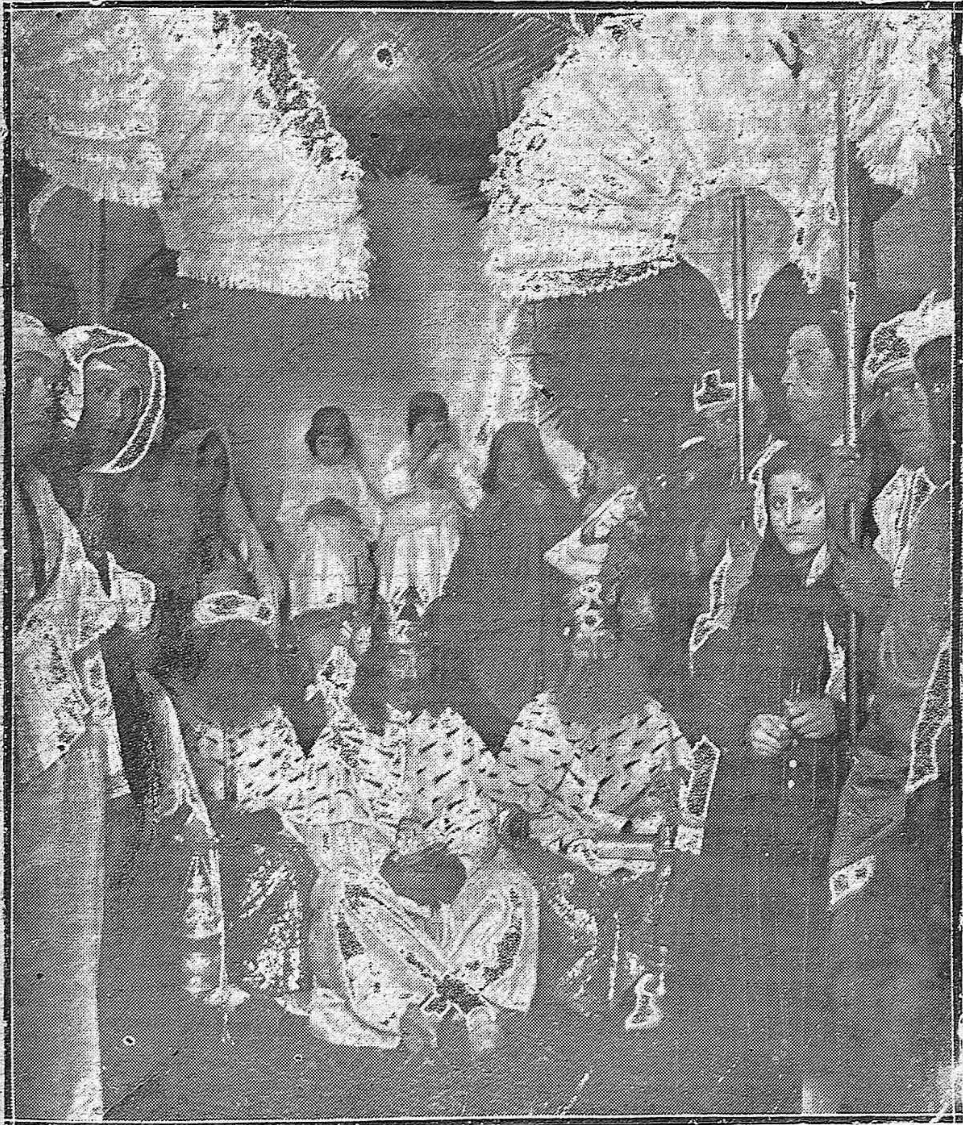
LA CABALGATA DE LOS REYES MAGOS, DESPUÉS DE LA ADORACIÓN EN EL PORTAL DE LA CASA PROVINCIAL DE MATERNIDAD.