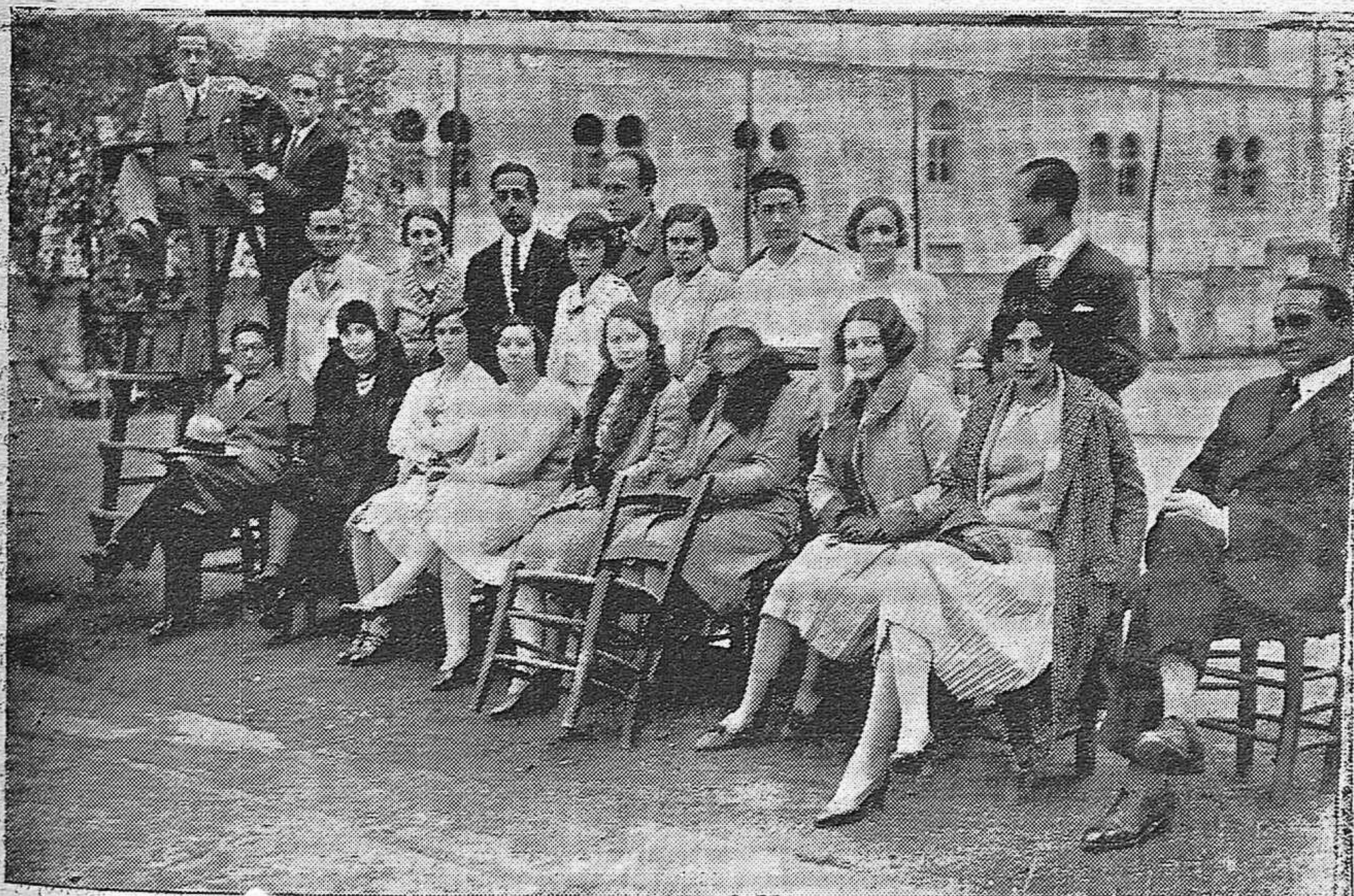
EN EL CAMPO DEL TENNIS CLUB.—DISTINGUIDAS SENORITAS PRESENCIANDO LAS JUGADAS PARA LA COPA DE AÑO NUEVO