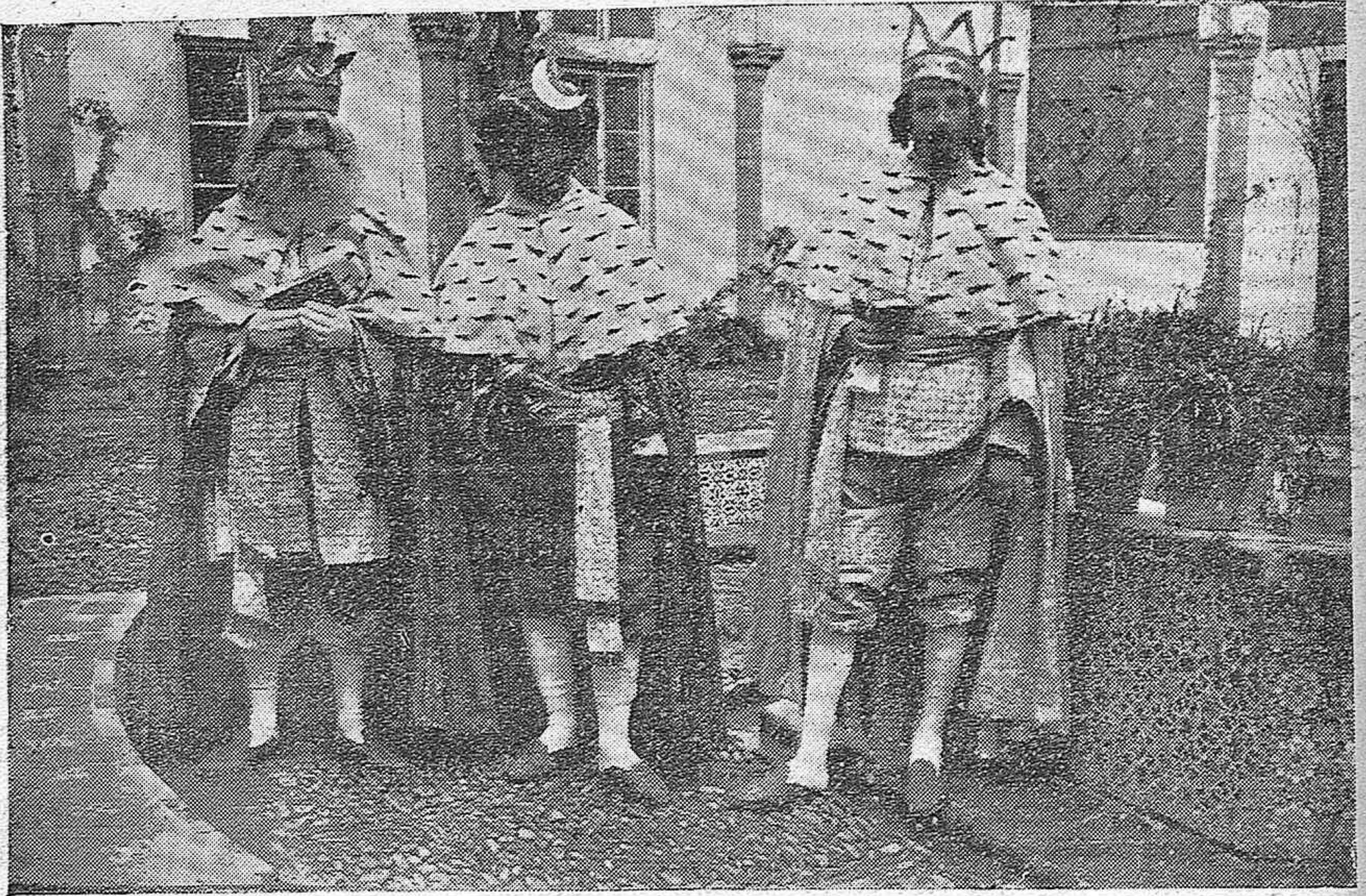
LOS TRES REYES MAGOS DE LA CABALGATA DE AÑOCHÉ.

SS. MM. visitan los establecimientos de beneficencia municipal y provincial.