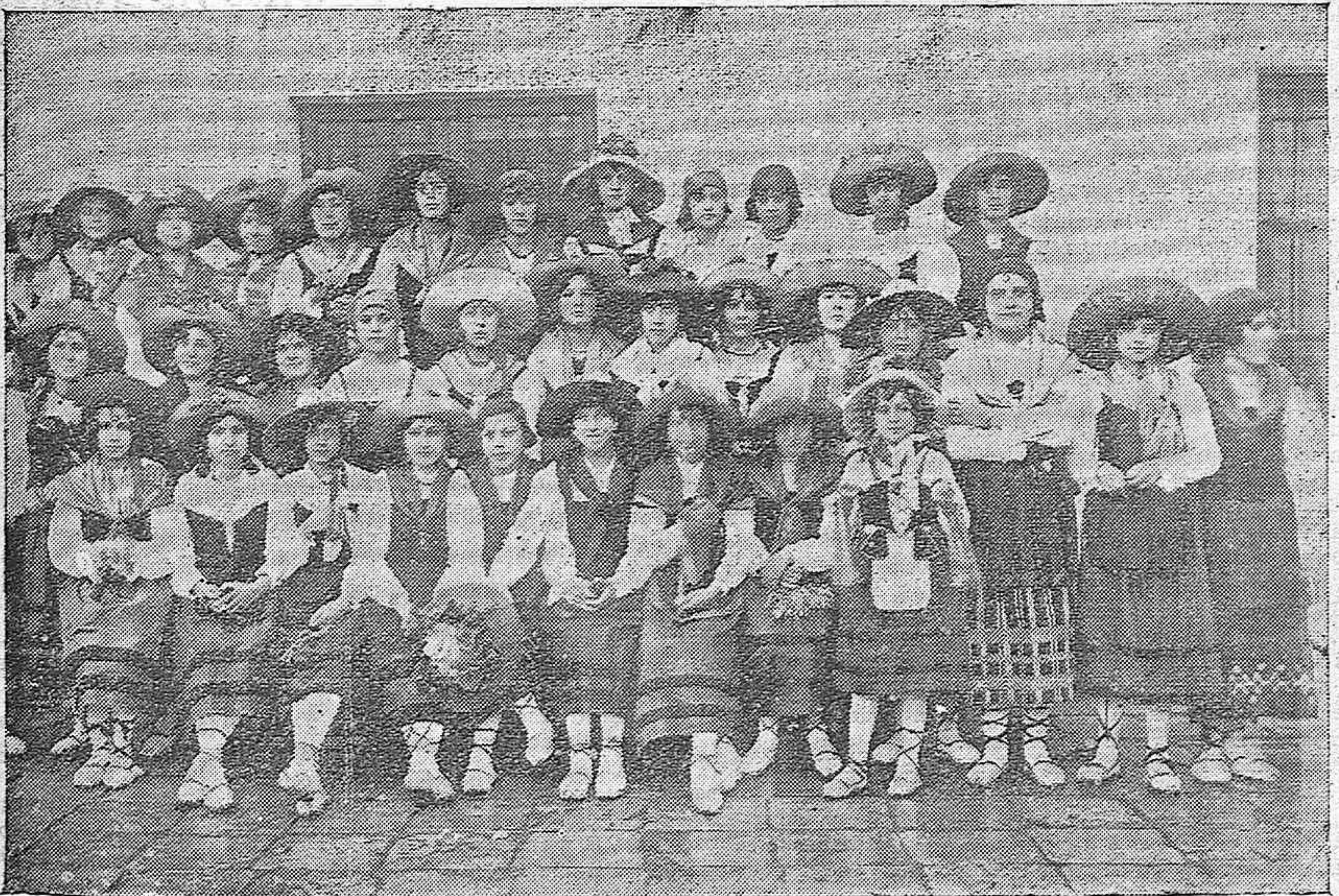
LINDÍSIMAS PASTORAS QUE FORMARON NE LA CABALGATA DE LOS REYES MAGOS.

Cerca de las once volvió la Cabalgata a su procedencia, terminada su triunfal carrera por las calles de la población.