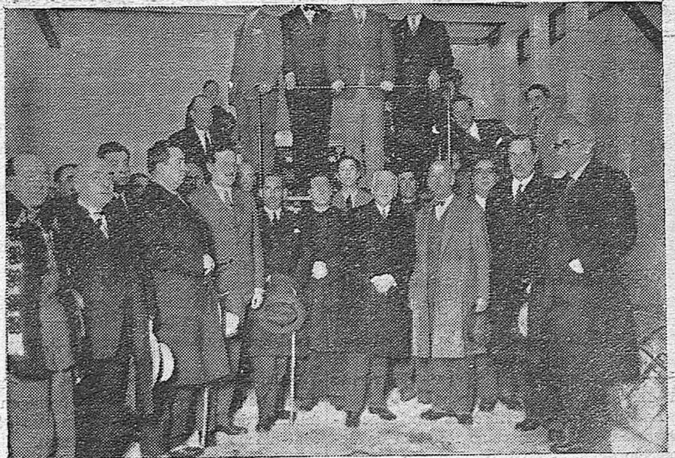
LAS AUTORIDADES CORDOBESAS Y ALGUNOS INVITADOS EN EL ACTO DE LA INAUGURACIÓN DE NUESTRA CASA Y MAQUINARIA.

La boda ha sido fijada para fines de Enero.