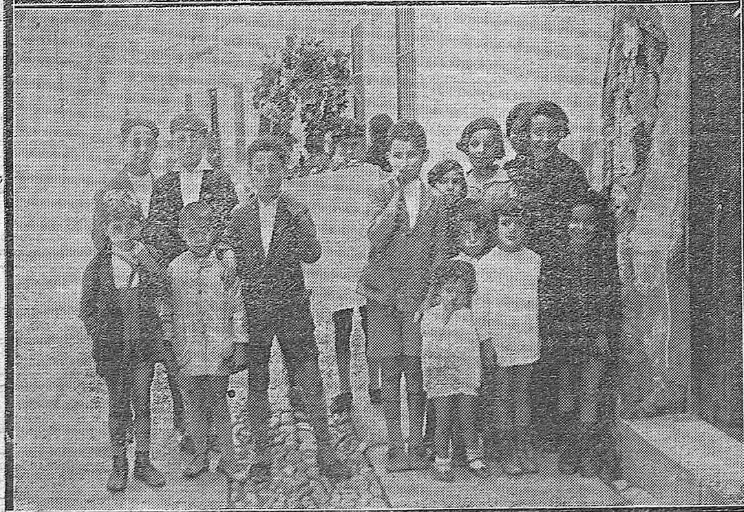
ESCENAS POPULARES: LAS CRUCES CALLEJERAS.—Dos cruces llevadas por niños, y que, entre con muchas, recorren durante el día de hoy las calles de la población.