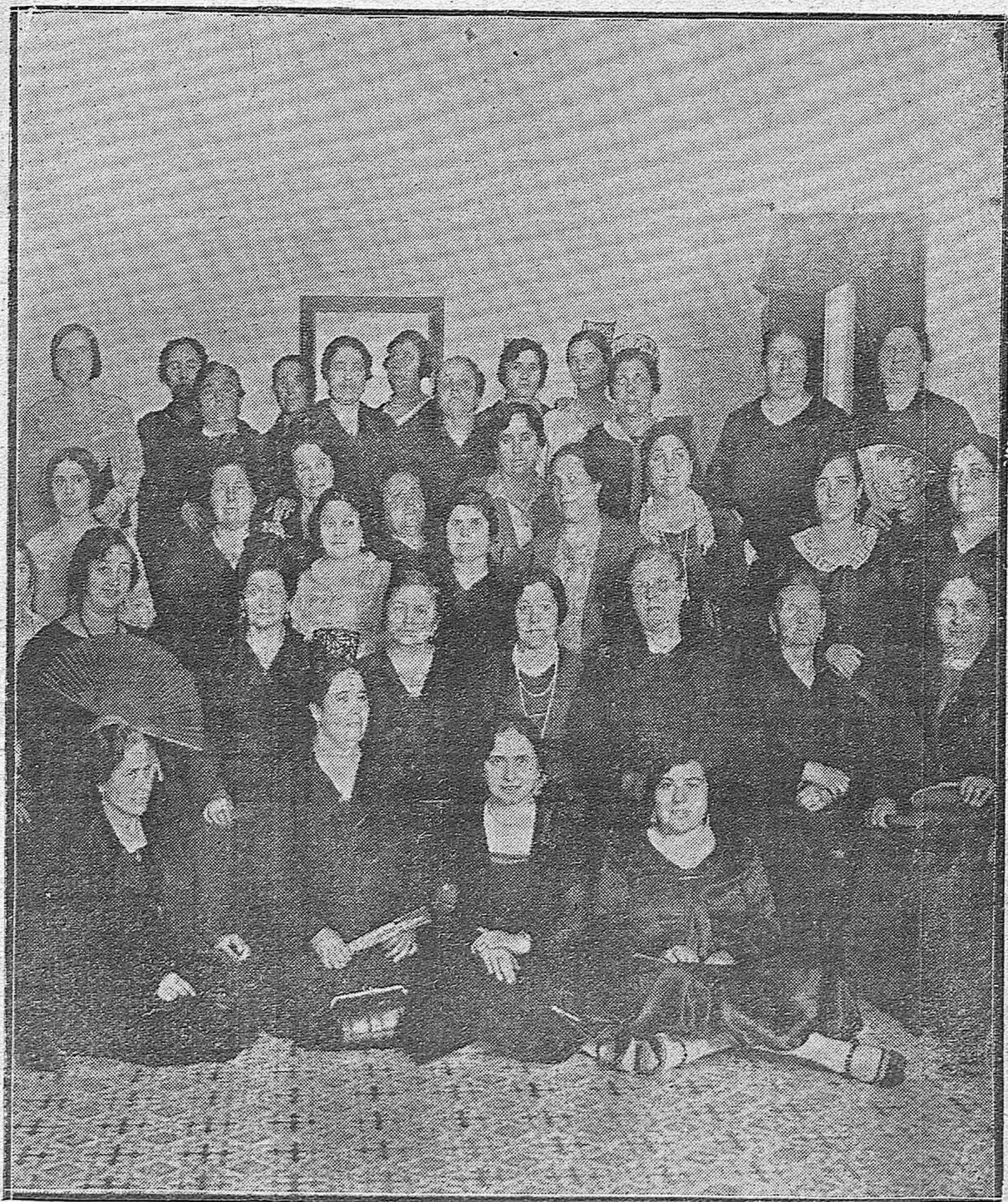
UNA ASAMBLEA.—ASAMBLEA DE LAS MATRONAS DE LA PROVINCIA, CELEBRADA EN EL LOCAL DEL COLEGIO OFICIAL DE MATRONAS.