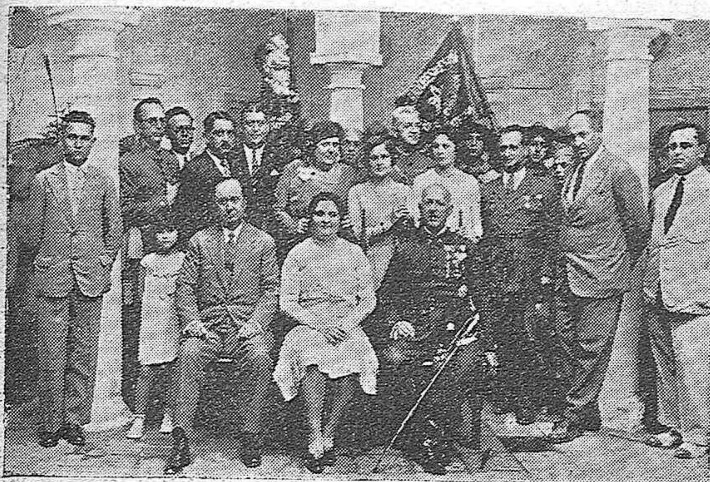
LA MADRINA DE LOS EXPLORADORES CON LAS PERSONALIDADES QUE ASISTIERON A LA FIESTA DE LOS EXPLORADORES.