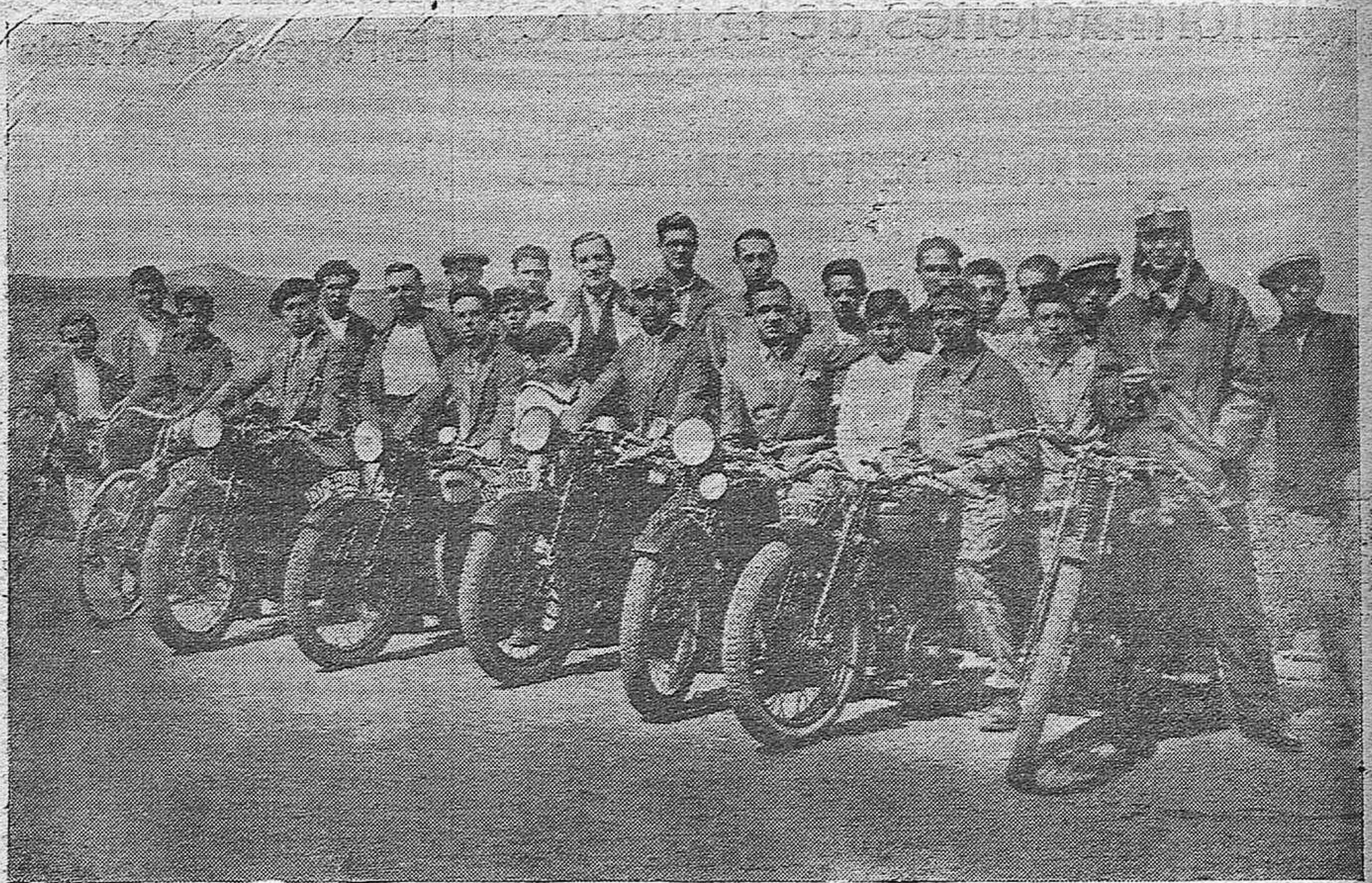
CARRERA DE MOTOS EN LA CUESTA DE LOS VISOS.—LOS CORREDORES DISPUESTOS PARA LA CARRERA.