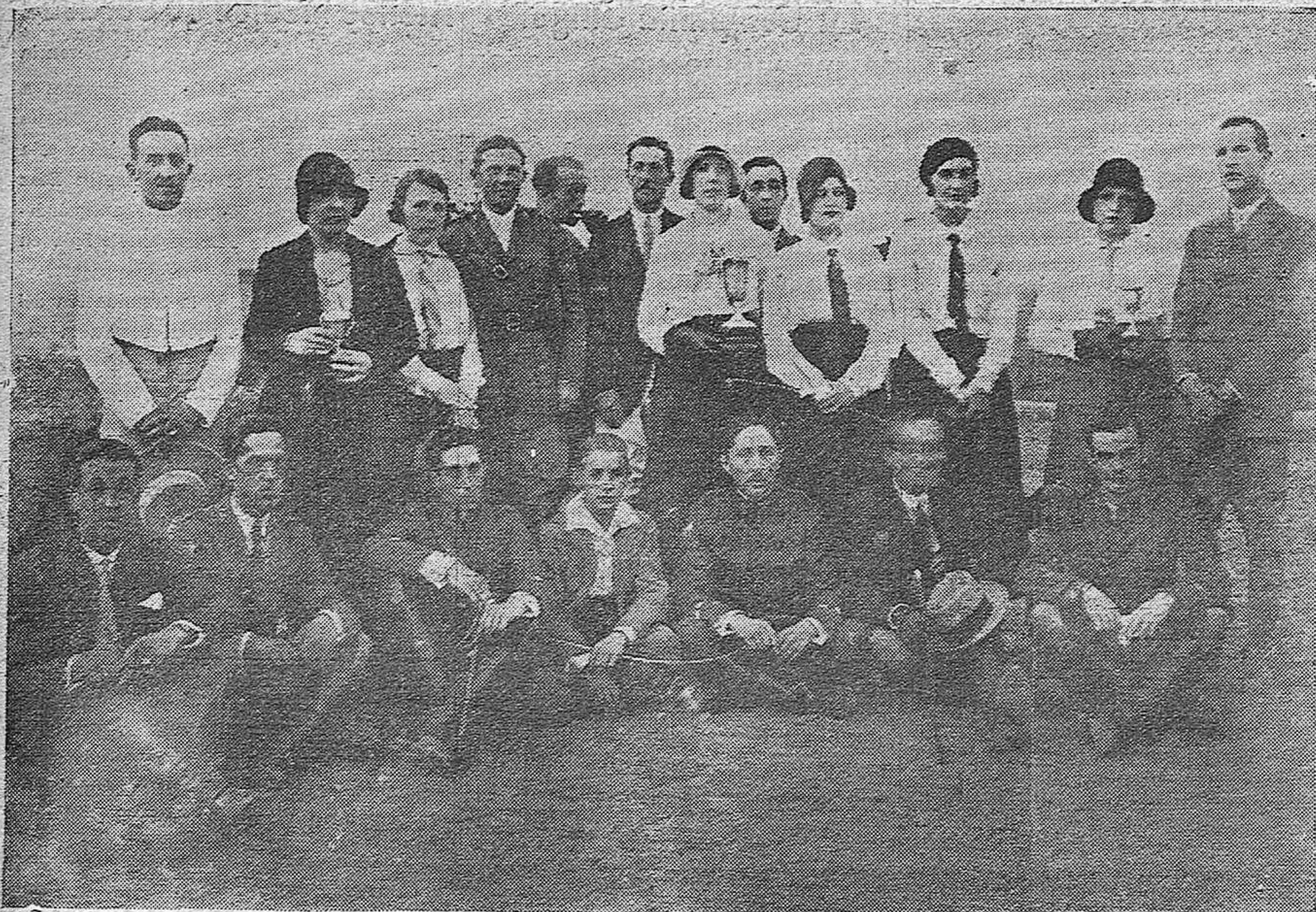
EL RAYLLY PAPER.—GRUPO DE JUGADORES.