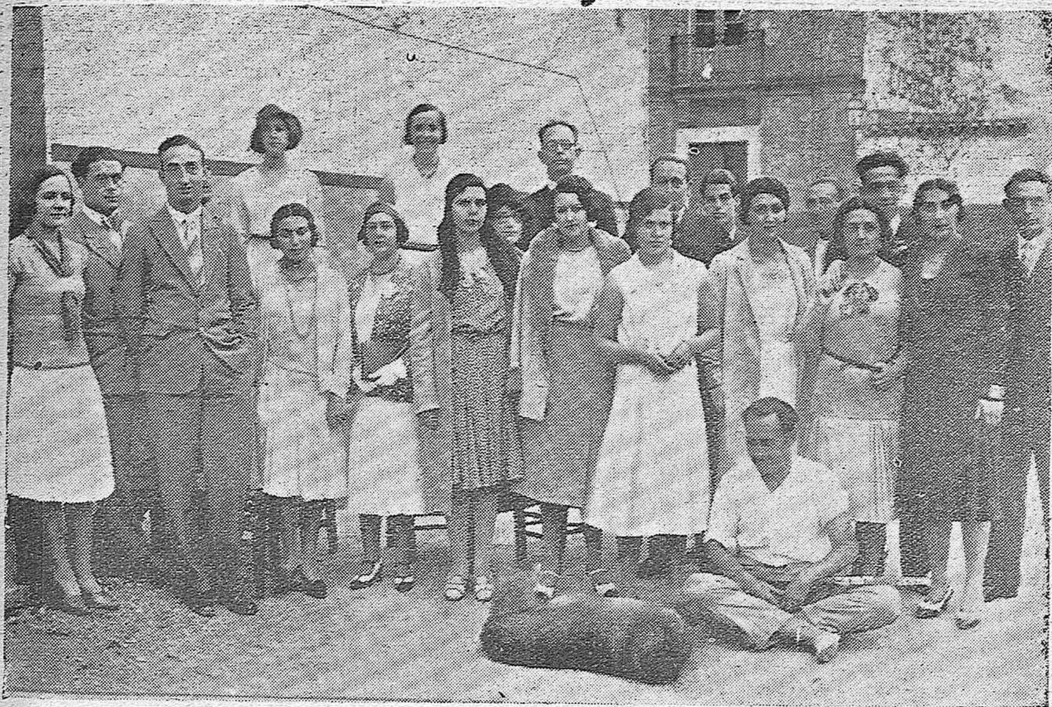
EN EL CAMPO DE TENNIS.—JUGADORES QUE SE HAN DISPUTADO EL CAMPEONATO 1930.