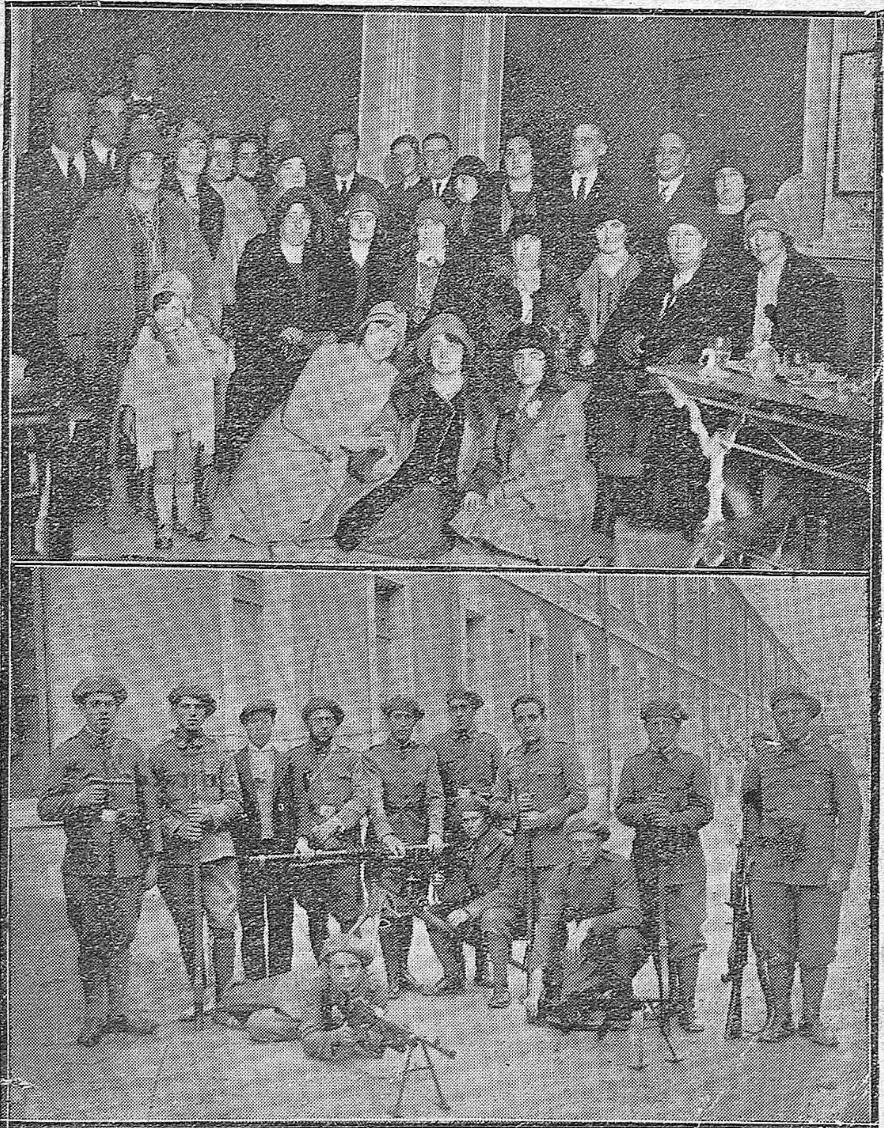
Maestras nacionales de Guadalajara, que estuvieron en nuestra capital en viaje de estudio.— Clases y soldados del Regimiento de la Reina, premiados en el concurso de tiro.