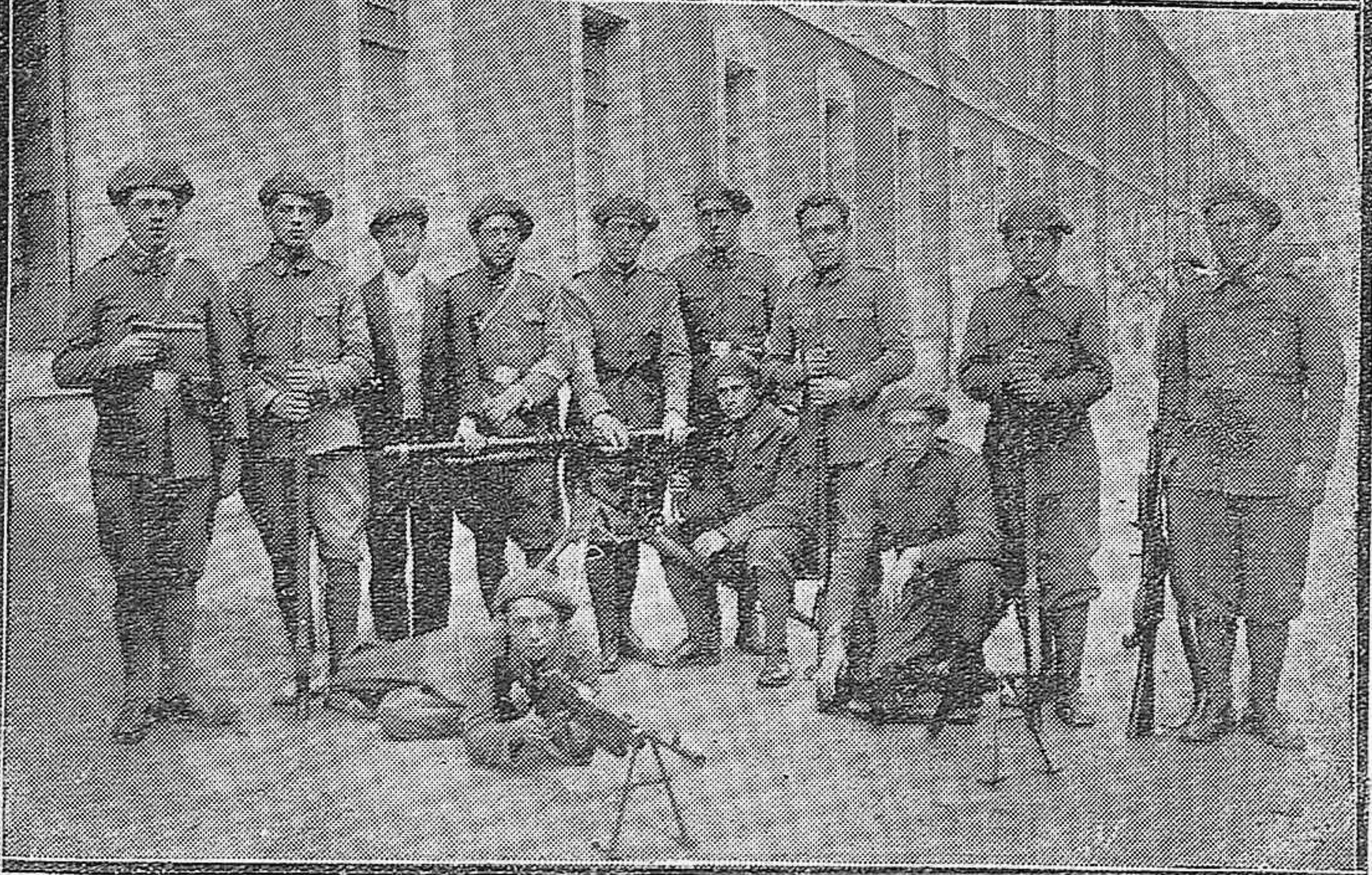
Maestras nacionales de Guadalajara, que estuvieron en nuestra capital en viaje de estudio.— Clases y soldados del Regimiento de la Reina, premiados en el concurso de tiro.